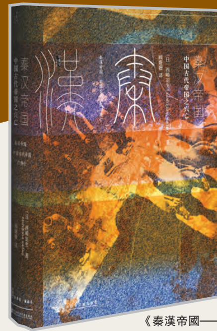
《秦漢帝國——中國古代帝國之興亡》

「甲骨文」是社會科學文獻出版社旗下專注出版歷史、國際政治、人文和社會學等門類學術暢銷書和經典學術書的子品牌，換句話說，做的是「社科書裏寫得好看的」，或者說是「小眾中的大眾」。雖然創立不過四年半，卻已培養了一批熱衷於更有深度地關心世界史的年輕一代「骨粉」，像《地中海史詩三部曲》3本書可以銷售近18萬冊，《天國之秋》出版後銷售超過6萬冊，100多萬字的三卷本《世界的演變：19世紀史》去年11月上市後無論內容還是裝幀都備受好評，或許意味著，這條路也許可以走得通。 最近「甲骨文」接連推出數本國外學者關於中國歷史不同朝代的論著，本報將擇期予以介紹。 香港商報記者 金敏華