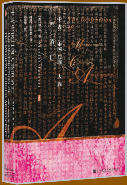
《中古中國門閥大族的消亡》