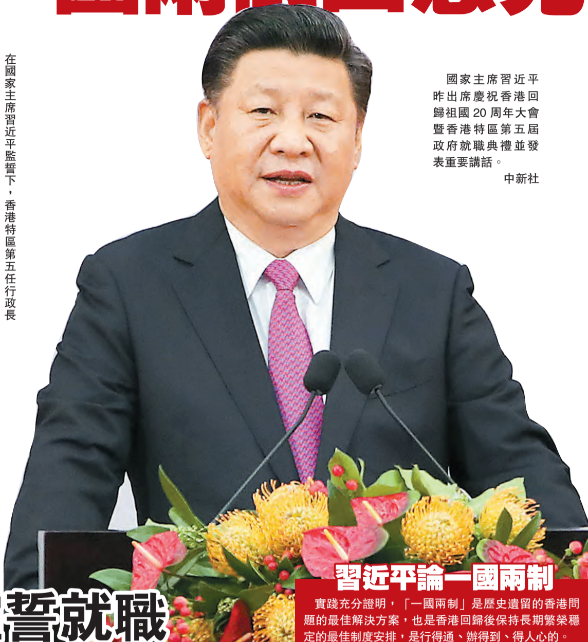
國家主席習近平昨出席慶祝香港回歸祖國 20 周年大會暨香港特區第五屆政府就職典禮並發表重要講話。

【香港商報訊】慶祝香港回歸祖國 20 周年大會暨香港特別行政區第五屆政府就職典禮 1 日上午在香港會展中心隆重舉行。中共中央總書記、國家主席、中央軍委主席習近平出席並發表重要講話。他強調，「一國兩制」是中國的一個偉大創舉，是中國為國際社會解決類似問題提供的一個新思路新方案，是中華民族為世界和平與發展作出的新貢獻，凝結了海納百川、有容乃大的中國智慧。堅持「一國兩制」方針，深入推進「一國兩制」實踐，符合香港居民利益，符合香港繁榮穩定實際需要，符合國家根本利益，符合全國人民共同意願。中央貫徹「一國兩制」方針堅持兩點，一是堅定不移，不會變、不動搖；二是全面準確，確保「一國兩制」在香港的實踐不走樣、不變形，始終沿着正確方向前進。（習近平講話全文刊 A8 版）