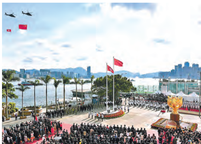
金紫荊廣場慶祝回歸20周年升旗儀式。

作為國際航空中心，香港國際機場去年的客運量達7000萬人次，位列世界第三；而貨運量超過450萬公噸，更是全球第一。機場客運量和貨運量相比1997