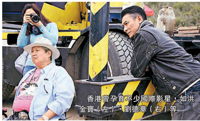
香港曾孕育不少國際影星，如洪金寶(左)、劉德華(右)等。

徐小明又提到，在2013年粵港合作聯席會議第16次會議中，廣電總局授權廣東省廣播電影電視局，可審批於廣東省內舉辦對外電影交流展映活動，並審查相關影片包括港產粵語片，當將來影片於廣東省作商業發行時，廣電總局會盡量配合加快審批，以便縮減審批工作所需時間，有助港產粵語片更快捷方便地進入廣東市場。他認為：「廣東是一個票倉，佔全中國票房約七分之一，香港可以捉緊這個機會，而政府也可幫忙商討爭取更多允許，為港產片開拓更多發展空間。」他直言香港根基深厚，而且擁有最重要的寶石——創意，當能充分利用這個長處與內地資源結合，準確掌握機會，或可以走出困境，藉着「一帶一路」再創一個新局面。