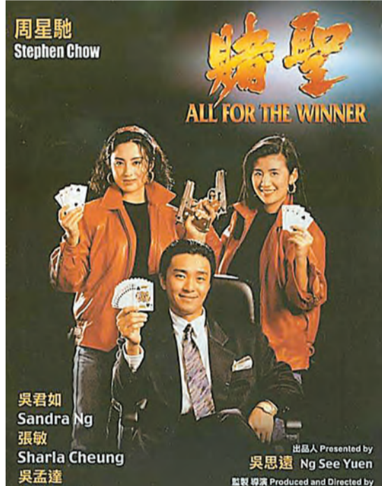
昔日港產片票房曾創造不少輝煌成績，如1990年周星馳主演的港產片《賭聖》，票房收入便高達4000多萬港元。

提到CEPA，徐小明力指政府只是紙上談兵，根本沒有實質為業界掌握機遇，「我以前曾跟內地一位領導談論過，他表示上任至今，香港管理文化的部門從沒有跟他接觸洽談，也沒有代表影視界去溝通，到底該如何借助CEPA進軍內地，或是香港同行有什麼訴求。香港政府永遠都是這樣，無人跟進、無人推動、也無人組織，形同虛設！」他認為這是令影視界衰落的第二個原因，「雖然香港發展局、香港發展基金可資助200萬元讓業界拍戲，但申請文件繁多，填完表格又要整理資產表，做完一切手續比拍一部電影更辛苦，令業界望門卻步，寧願向其他人叩門。現在大家看到的增長，並非由政府扶持所得，而是業界自己努力。不過，電影界還