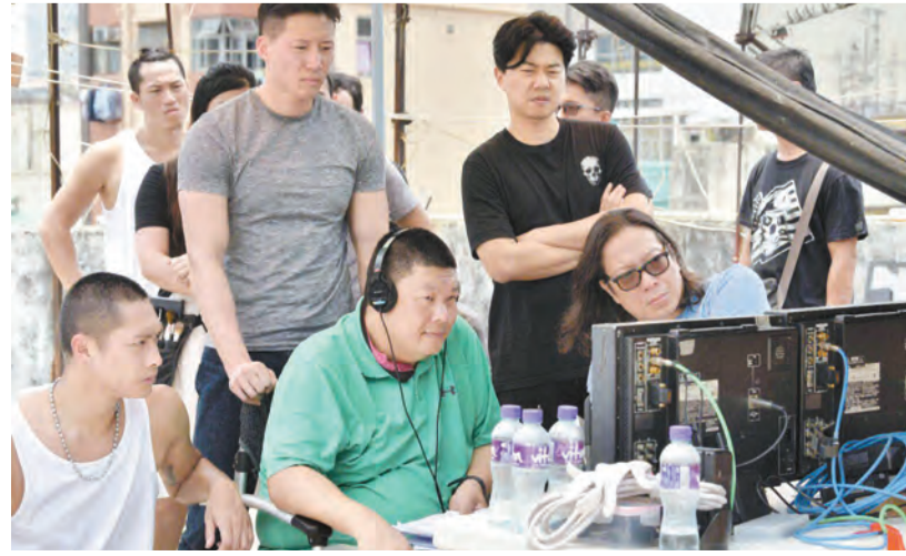
港漫 IP 電影《燃燒的夏》拍攝現場