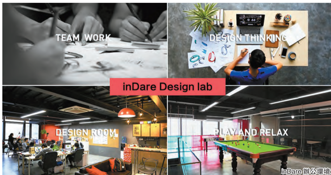
inDare Design lab

最主要的原因則是「有著一顆不安分的心」。創立inDare之前，陳鋒明一直在港從事產品設計與品牌設計