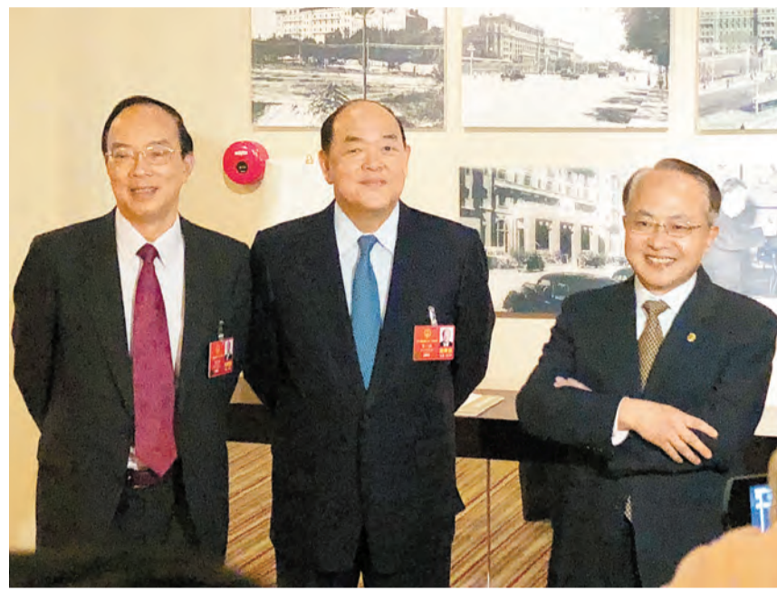
右起中聯辦主任王志民、澳門立法會主席賀一誠、港區全國人大代表團團長馬逢國在會後接受記者採訪。

【香港商報訊】本報兩會特派採訪組報道：十三屆全國人大一次會議明天將在北京開幕。昨天下午，全國人大常委會副委員長兼秘書長王晨專程來到北京飯店，看望出席是次大會的港澳全國人大代表。他向港澳代表提出三點希望：一是凝心聚力開好會；二是履行職責建言獻策，提出有針對性實事求是的建議；三是遵規守紀。