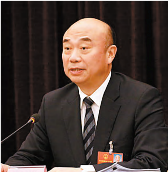
全國人大代表、陝西省長劉國中

產業結構的優化升級；培育新產業、新動能、新增長極，做實做強實體經濟，構建起多元發展支撐的現代新經濟體系。 大力實施創新驅動發展戰略。紮實推進創新性省份、西安市全面創新改革試驗、西安高新區國家自主創新示範區、西咸新區和楊凌「雙創」示範基地等國家創新試點示範建設，全面提高創新供給能力，促進新動能持續快速成長。挖掘好、利用好、滋養好科教資源，促進軍民融合、部省融合、央地融合，推動陝西的「雙創」登上新台階。 持續擴大改革開放。主要是打造交通商貿物流、國際產能合作、科技教育、國際文化旅遊、絲綢之路金融5個大的中心，特別是進一步加大「放管服」的改革力度，為市場主體和廣大人民群眾提供良好的環境。