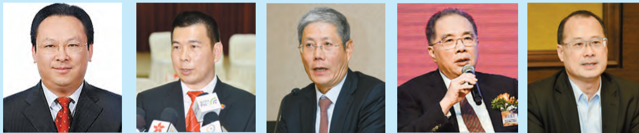
譚鐵牛 譚錦球 傅育寧 周安達源 蔡冠深

【香港商報訊】本報兩會特派採訪組報道：全國政協十三屆一次會議昨日舉行全體會議，選出新一屆政協主席、政協副主席、秘書長和政協常委。前行政長官董建華及梁振英都連任政協副主席。有18位港區政協委員當選政協常委，其中連任的有8人，包括唐英年、李澤鉅等；新任的則有10人，包括陳馮富珍、林建岳、林淑儀等。無論是新當選的、還是連任的政協常委都感到榮幸，希望做好工作，貢獻國家。