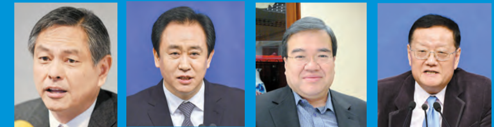
何柱國 許家印 胡定旭 劉長樂