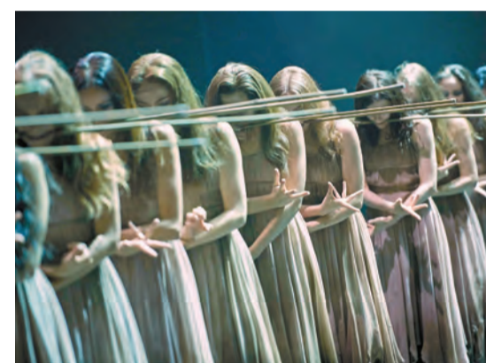
艾甘·漢運用創新的手勢詞彙和幽靈形象，讓觀眾沉浸在與別不同的芭蕾舞語言中。