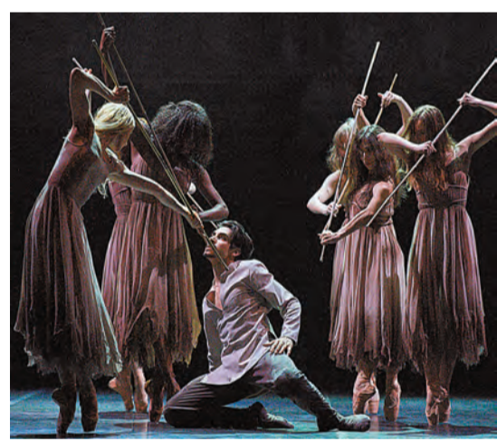
幽靈替吉賽爾向負心漢阿爾貝特報復，惜吉賽爾餘情未了，誓要保護愛人免受傷害。

是次與艾甘·漢合作的英國國家芭蕾舞團成立於1950年，雲集全球頂尖舞者，他們曾接受古典派訓練，技藝高超，曾在2014及2016年的英國國家舞蹈大獎勇奪史提夫·斯蒂芬奴傑出舞團獎。對於是次舞作，艾甘·漢表示：「有趣的是，我的舞蹈詞彙看上去有點不同。我嘗試保留箇中精髓，但又努力強調芭蕾舞肢體的力量。」艾甘·漢過往以融合當代舞蹈和印度卡塔克舞而聞名，善於吸收和轉化古典文化，並將之與現代芭蕾舞結合，是次與英國國家芭蕾舞團合作，將擦出怎樣的火花，備受期待。