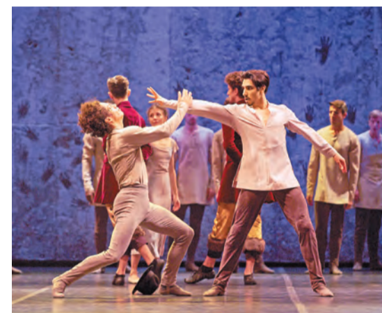
著名設計師葉錦添負責視覺及服裝設計，打造出優美華麗的舞台。