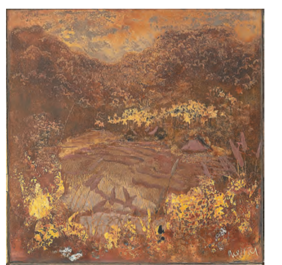
阮嘉智作品，《稻田風景》，約 1946 年作。

藝術品成越南縮影 席爾斯飽遊亞洲，對整個亞洲的現、當代藝術深感興趣。展場還有以極簡形式命名的台灣藝術家林壽宇和法籍華裔藝術家常玉的早期作品，除此之外，還有越南藝術家的作品，各位或許對於當地藝術並不了解。越南受到法殖民地的影響，也是處處瀰漫藝術氣息。參展的黎譜、梅忠恕、阮嘉智和范厚是越南現代藝術史上頂尖的四位藝術家，亦是河內一間著名藝術學院的校友，該學院由法國畫家 Victor Tardieu 於 1925 年創辦，而黎譜和梅忠恕更是學院的首批學生。二人受到 Tardieu 和學院的鼓