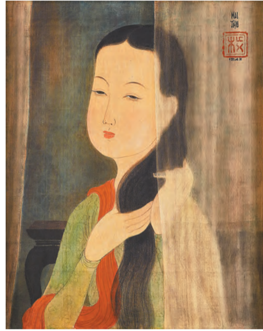
梅忠恕作品，《梳妝仕女》，1943 年。