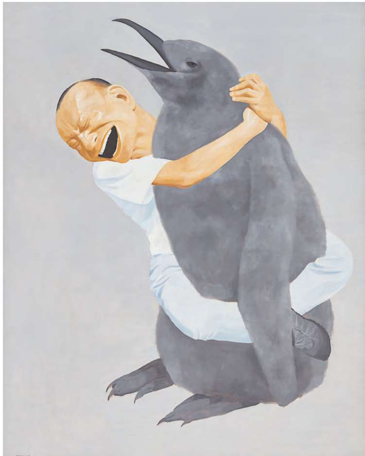
岳敏君作品，《企鵝》，1999 年。

同場並將會展示阮嘉智和范厚漆畫作品，其中阮嘉智的《稻田風景》是以越南美景為主題，雖然作品尺寸特別小，然而風景的細節詳盡無遺，運用了西方藝術的透視法，賦予畫面深度，利用閃爍的漆顏料特性和金色油漆，體現了鬱鬱蔥蔥的和諧景觀，將越南和西方藝術特色完美地融合。觀者不但能看到藝術家們向人民及文化吸取靈感的作品，並能透過展品目睹當時的歷史背景。