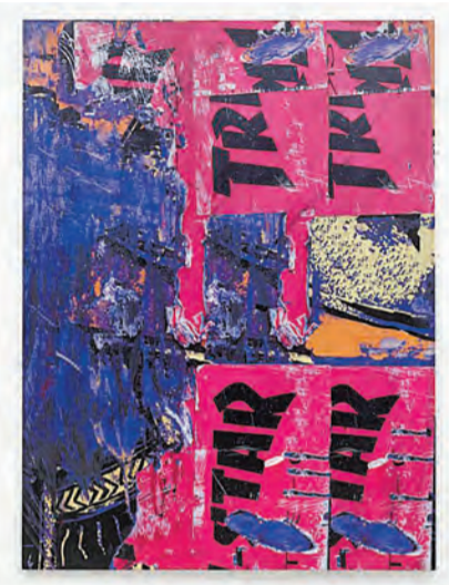
克里斯·蘇科作品，《SHR 1068803》，2018 年。

內容：經常說「藝術源於生活，但高於生活」，德國藝術家克里斯·蘇科創作的「鋸齒」繪畫系列是源於其詩詞，並受到工作室背景音樂的靈感所創造以線為主題的作品。抽象作品反思了繪畫的行為：草圖被覆蓋上顏料的過程，展覽「撕碎與鋸齒」現正展出該系列作品。是次亦帶來全新系列「撕碎」的作品，新系列是透過攝影及複印的手法投射印於繪畫上，並覆蓋多層聚合物漆，顯示了崎嶇的表面和被蹂躪的搖滾音樂海報。靈感源於拍攝的老舊滑板主人的獨特個人風格，包括音樂喜好、不安、恐懼等感受，亦是藝術家想傳達給觀者的感受。 文：儀