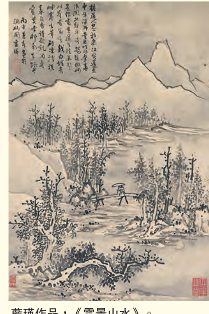
藍瑛作品，《雪景山水》。

藍瑛（1585-1664，一作 1585- 約 1666），字田叔，號蝶叟，晚號石頭陀、山公、萬象阿主者、西湖研民，又自署東郭老人，所居榜額曰「城曲茅堂」，錢塘（今杭州）人，明末清初著名畫家。《國朝畫徵錄》論曰：「畫之有浙派始自戴進，至藍瑛為極。初不為人所重，近代始被推崇。」藍瑛雖力追古法，但能融會貫通，自成一格，對以後的明末清初繪畫影響很大，是浙派後期代表畫家之一。 藍瑛的山水畫初從黃公望入門，作品清簡秀潤，韓昂在《圖繪寶笈續纂》中說他：「畫從黃子久（即黃公望），入門而醒悟。」中年以後自立門庭，上窺晉、唐、兩宋，偏注重仿效元代諸家，涉獵既多，眼界宏遠，故落筆縱橫奇古，氣象峻嶒，其竹、