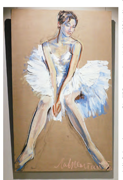
拉夫連季·布魯尼作品，《謙虛》，2013 年。

內容：人們經常拿花比作漂亮的女士，而這兩種元素亦經常出現在藝術家的作品當中。藝術家拉夫連季·布魯尼專注繪畫女芭蕾舞者和花，亦是自十六世紀以來意大利北部和瑞士著名的藝術家家族的 19 代傳人。對他而言女芭蕾舞者具有優雅體態的女性之美，花朵是一種聯想、人物，他會用它描繪一切事物。此展覽展示布魯尼 40 幅反映藝術家創作生涯不同階段與方向的繪畫作品，其中 13 幅是特別為這次展覽創作的，並重新詮釋，別具豐富內涵。 文：儀