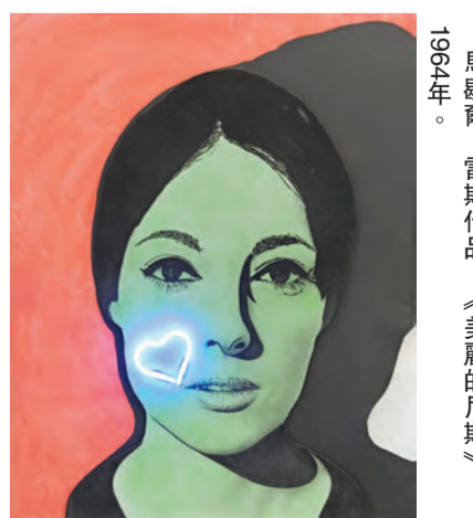
馬歇爾·雷斯作品，《美麗的尼斯》，1964 年。

內容：尼斯是法國南部港口城市，在有着溫暖陽光及一望無際海灘的地方會孕育出怎樣的藝術家？展覽「尼斯派 - 從波普藝術到偶發藝術」便展示了法國尼斯現代藝術和當代藝術博物館帶來的超過 100 件展品，其中包括繪畫、照片、雕塑、物件等，並會回顧藝術史上關鍵時刻。展出的藝術家包括伊夫·克萊因、阿曼、凱撒等，他們當時被視為藝術運動的開拓者，其後更成為極具影響力的人物，於紐約和洛杉磯獲得個展機會。參觀者可在展覽內了解馬歇爾·雷斯和阿曼早於美國藝術家安迪·華荷和詹姆斯·羅森奎斯特前，以樂器、盒裝洗衣粉等生活用品和消費主義作題材。 文：儀