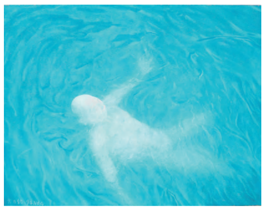
方力鈞作品，《第二系列編號 10》，1992 年。

張的笑容表達了社會所要求的強制性滿足的面具。這個系列作品是在「第 48 屆威尼斯雙年展」開始引起轟動，《企鵝》正是創於那一年。該作品捕捉了藝術家為人所周的肖像，咧口大笑、滑稽地擁抱企鵝，高度超現實。值得注意的是，它和方力鈞的《第二系列編號 10》都從未出現過在拍賣場。《第二系列編號 10》是方力鈞早期的重要作品，畫中的女性、兩位男子及在波濤洶湧水面上浮現的三個禿頭人物出現在海上，呈現了 1978 年改革開放後社會的自由和富裕的氛圍。另一幅方氏的《1994 編號 4》是出席巴西「聖保羅雙年展」那年創作，描述了