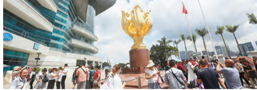
香港大學預料本港第三季 GDP 放緩至 3.9%。

報告指，預期 2018 年第三季實質 GDP 增長率將減慢至按年 3.9%。相比 2017 年 3.8% 的全年增長，預測 2018 全年將以較高速率持續增長，預料 2018 全年實質 GDP 增長為 4%。報告指出，本港 2018 年本地生產總值平均物價指數第二季按年增長率預測為 2.7%，第三季為 2.4%；綜合消費物價指數第二季按年增長率預測為 1.6%，第三季為 2%；失業率第二季及第三季按年增長率預測為 2.8%。