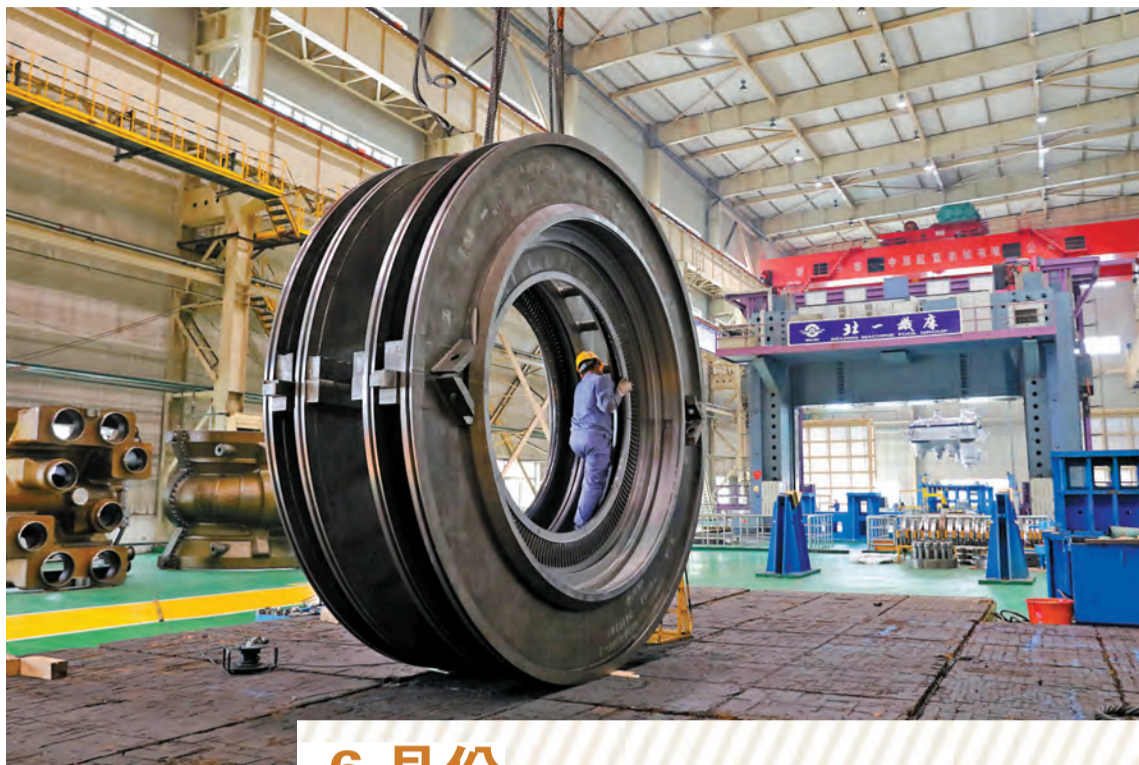
今年上半年央企利潤8877.9億元，創歷史同期最好水平。