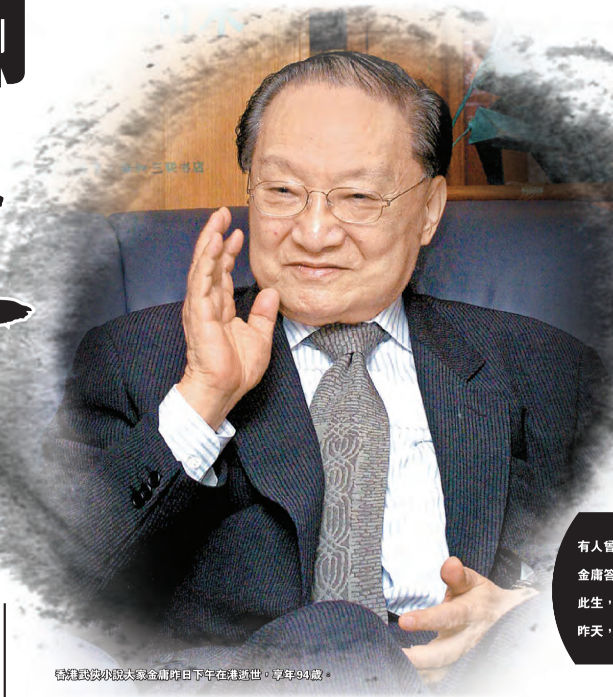
香港武俠小說大家金庸昨日下午在港逝世，享年94歲。

有人曾問：「人生應如何度過？」 金庸答曰：「大鬧一場，悄然離去。」 此生，他大鬧一場； 昨天，他悄然離去！