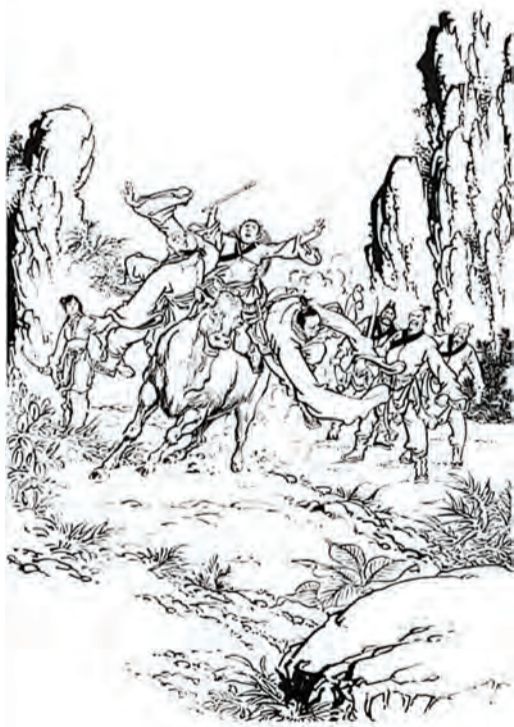
根據金庸武俠小說創作的連環畫。 資料圖片

半個多世紀以來，金庸小說一直是全世界華人讀者的最愛，不斷被改編成影視劇、舞台劇、動漫、網絡遊戲等，掀起過多股熱潮。學術界也非常重視金庸作品，「金學」已經成為人文科學研究中的一門顯學，港澳台和內地都有大量的研究專著出版。