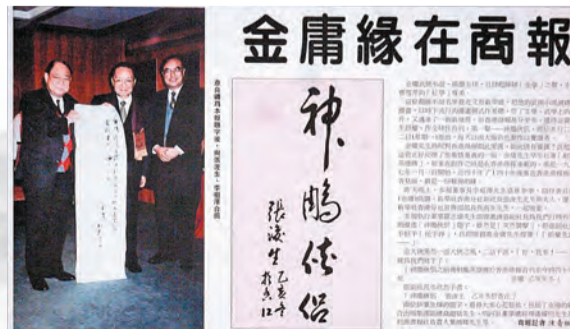
金庸到訪第二日本報的專題報道。 資料圖片