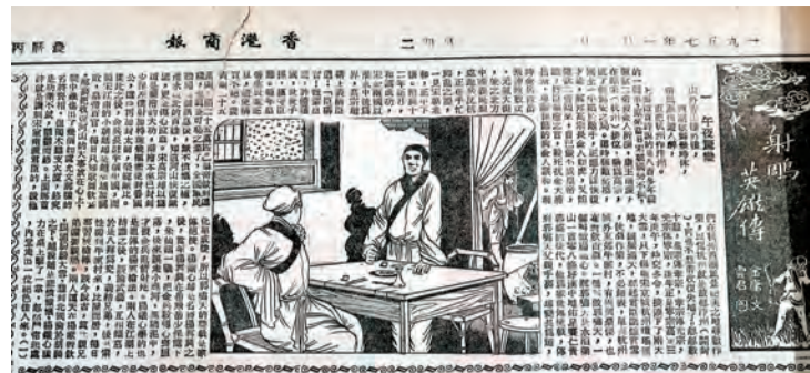
《射鵰英雄傳》在本報刊出的第一篇。 資料圖片