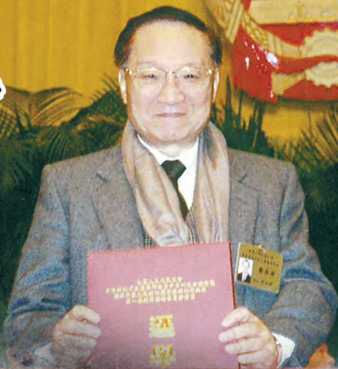
查良鏞出任基本法起草委員會委員，為香港回歸祖國作貢獻。