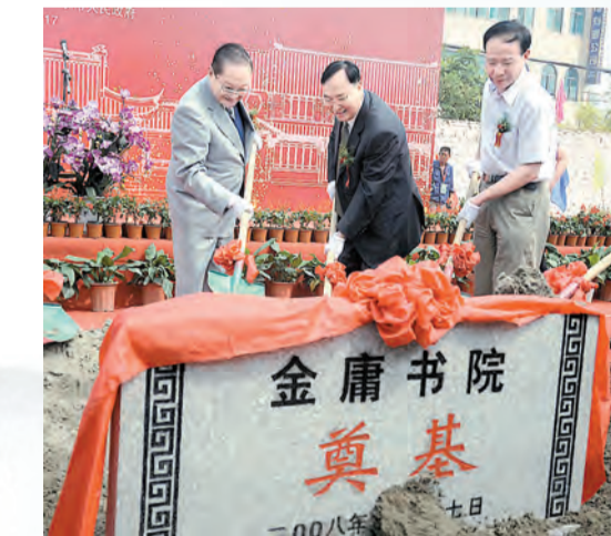
2008年9月17日，金庸(左)在家鄉浙江海寧，為以其命名的金庸書院奠基。