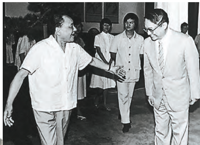
1981年7月，鄧小平(左)在北京接見到訪的查良鏞(右)。