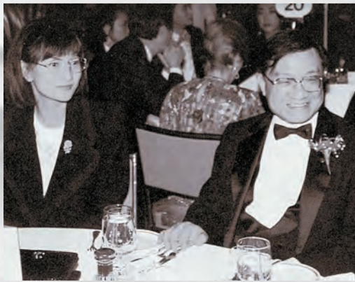
金庸與第三任妻子林樂怡。

【香港商報訊】記者莊海源報道：查良鏞(金庸)不但是華人世界文壇巨匠，而且在香港政壇甚具影響力。回歸前，查良鏞曾在北京獲鄧小平接見，又出任基本法起草委員會政制小組港方召集人。他聯同另一名基本法草委查濟民提出的「雙查方案」，更是回歸後香港政制發展的參考。可以說，查良鏞為香港的順利回歸和回歸後的政制發展起到了舉足輕重、不可磨滅的積極貢獻。