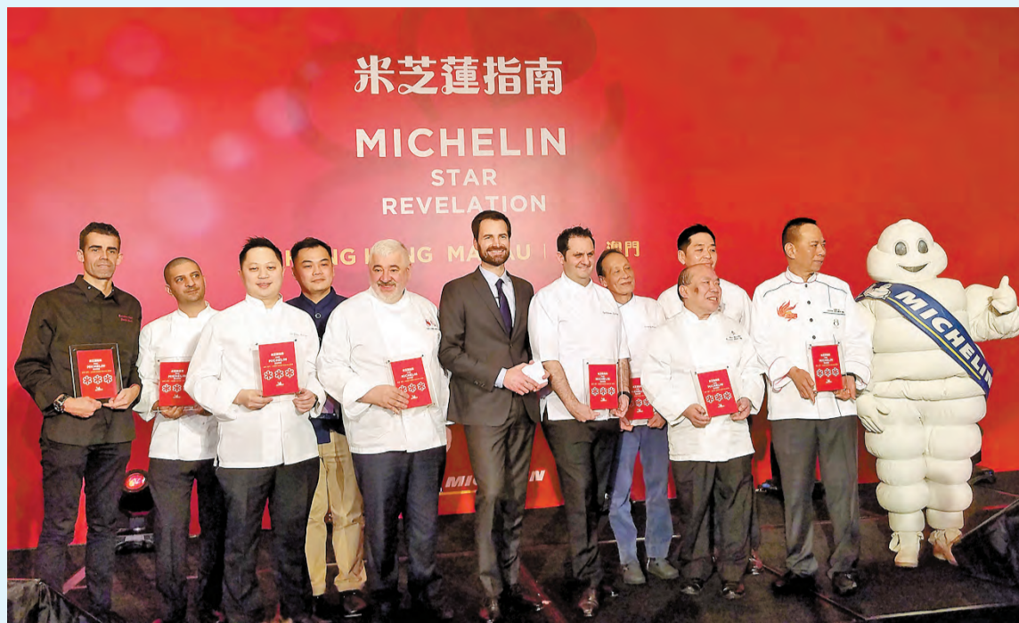
米芝蓮昨日公布最新一年的《米芝蓮指南香港澳門2019》，今年共有10間三星餐廳。

而鮑、齋藤是今年新上二星榜的餐廳，其總廚小林郁哉表示，對於餐廳只開業了8個月便獲二星感到很興奮，希望明年能取得更佳成績。他又指，雖然東京店是三星餐廳，但亦沒有給壓力香港的團隊，而自