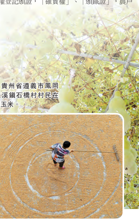
小崗村發展新型農業經營形式後種植起來的葫蘆。

億萬農民的「定心丸」 家庭聯產承包責任制、免除農業稅、三權分置等一系列強農惠農政策的實施，讓一些農村問題得到了解決，但山區農民如何擺脫貧困，以及農村社會全面建成小康社會仍然是當前亟待解決的問題。 1997年8月中共中央下發通知指出，在第一輪土地承包的基礎上，土地承包期再延長30年。2001年12月30日，中共中央下發了《關於做好農戶承包地使用權流轉工作的通知》，允許土地使用權合法流轉，規定「農戶承包地使用權流轉要在長期穩定家庭承包經營制度的前提下進行」，並提出「農戶承包地使用權流轉必須堅持依法、自願、有償的原則」。2008年10月12日，十七屆三中全會通過《中共中央關於推進農村改革發展若干重大問題的決定》，提出加強土地承包經營權流轉管理和服務，建立健全土地承包經營權流轉市場。 之後十九大報告首次提出「實施鄉村振興戰略」，並明確提出保持土地承包關係穩定並長久不變，第二輪土地承包到期後再延長30年，對億萬農民來說，這是一顆「定心丸」；對農村集體產權制度改革而言，這是一粒「活絡丹」。