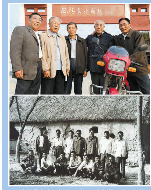
小崗村當年在一紙分田到戶「大包幹」生死契約上按下紅手印的農民的兩張合影，反映出今昔變化。

開始於1978年的農村改革已經走過了40年的光輝歷程，從土地家庭聯產承包責任制到土地流轉，再到土地確權、集體產權制度改革和鄉村振興，農村實現了從計劃經濟向市場經濟，從傳統農業向現代農業的轉變，農民的生產生活方式也發生了翻天覆地的變化。40年彈指一揮，農村土地改革的巨大成就不僅帶來了農村經濟社會的歷史性變化，而且有力地支持了整個國民經濟社會的深刻變革。 香港商報記者 黃鶯