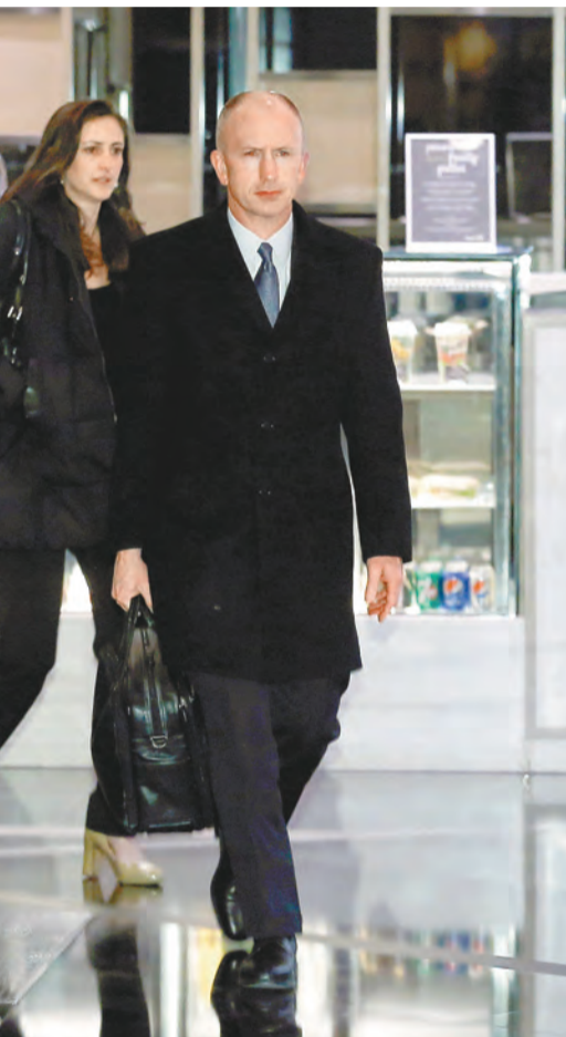
美國貿易代表團團長格里什。路透社

內部討論的官員指出，特朗普原本希望能在3月1日美中關稅休戰大限之前與習近平會面，但因時間上與特朗普和朝鮮領導人金正恩2月底的「金特二會」時間過於接近，難以安排。美官員透露，特朗普打算3月1日前先與習近平通話。「習特會」的時間點可能最快安排在3月中旬，地點可能選在海湖俱樂部，但也可能選在包含北京在內的其他地點，目前尚未定案。