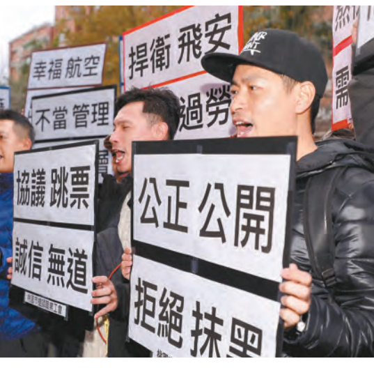
華航罷工二次協商再度破局。