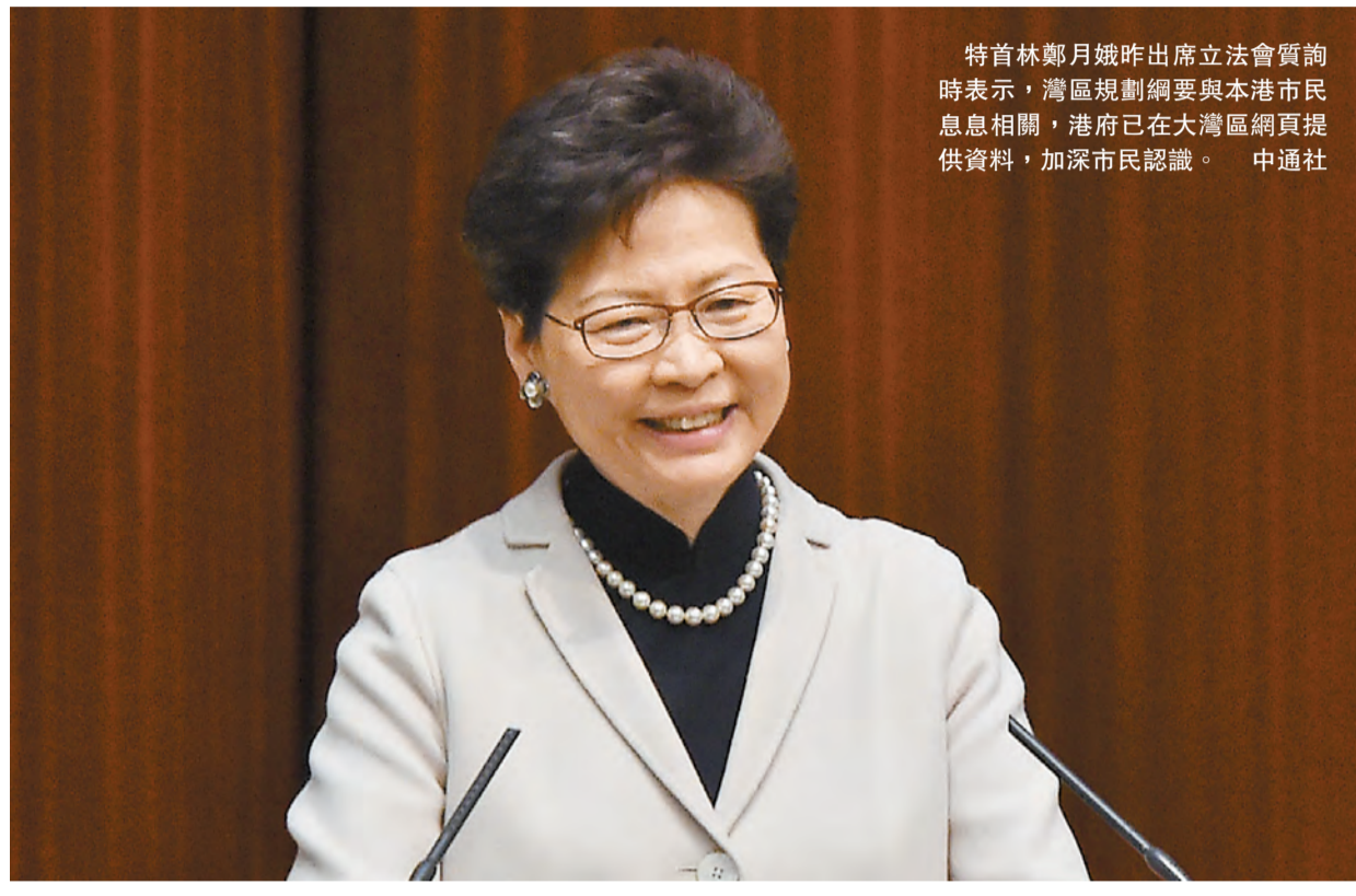
特首林鄭月娥昨日出席立法會質詢時表示，灣區規劃綱要與本港市民息息相關，港府已在大灣區網頁提供資料，加深市民認識。

【香港商報訊】記者周偉立報道：《粵港澳大灣區發展規劃綱要》（以下簡稱《規劃綱要》）日前出台，粵港澳三地政府將於今天在港聯辦宣講會。行政長官林鄭月娥昨日出席立法會質詢時表示，規劃綱要與本港市民息息相關，特區政府已在大灣區網頁提供資料，加深市民認識。她還透露，為配合規劃綱要推出，政制及內地事務局將作為統籌角色，與其他政策局參與宣傳推廣，讓各界加深認識，抓緊機遇，具體落實。