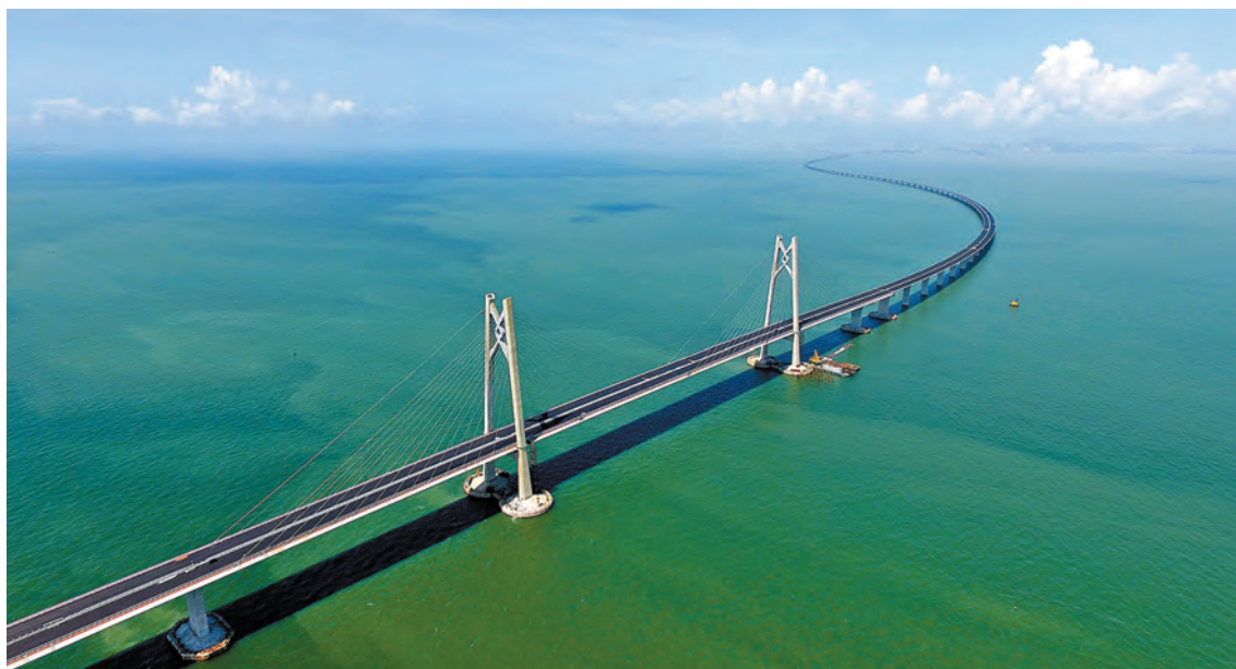
高速公路作為大灣區融合發展的重要交通網絡，料公路股可長期受惠於大灣區發展。

《粵港澳大灣區發展規劃綱要》發布後帶動一批概念股上揚，其中高速公路作為大灣區融合發展的重要交通網絡，料公路股可長期受惠於大灣區發展。其中，深圳高速公路(548)、越秀交通(1052)、合和公路基建(737)均有在大灣區布局高速公路項目，前景值得關注。 香港商報記者 范曉昱