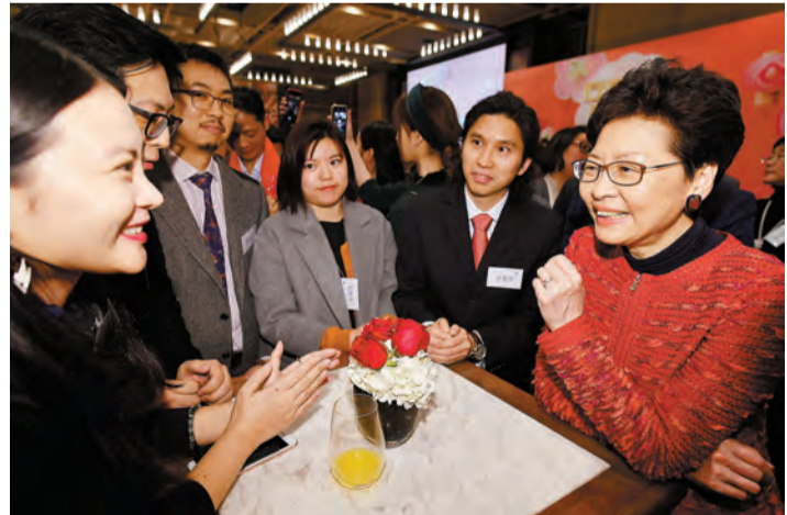
行政長官林鄭月娥昨晚與在北京工作、經商和就學的港人會面。

【香港商報訊】記者張麗娟北京報道：行政長官林鄭月娥昨晚會見傳媒時指出，《粵港澳大灣區發展規劃綱要》的公布，標誌着大灣區建設進入全面開展落實的重要階段。林鄭歡迎中央就推進粵港澳大灣區建設推出的八項政策舉措，這些措施將便利香港居民到大灣區內地城市發展、就業和居住，並加強大灣區內人流、物流等方面的便捷流通。該八項政策舉措包括在內地繳納個人所得稅關於「183天」的計算方法，即在中國境內停留的當天不足24小時，不計入中國境內居住天數；當地政府為境外包括香港的高端人才和緊缺人才提供個人所得稅稅負差額補貼；支持大灣區事業單位公開招聘港澳居民；鼓勵港澳青年到大灣區內地九市創新創業；支持港澳高校和科研機構參與廣東省科技計劃；開展粵港澳大灣區出入境便利化改革試點；便利港澳車輛進出內地口岸，以及擴大海關跨境快速通關對接項目的實施範圍。