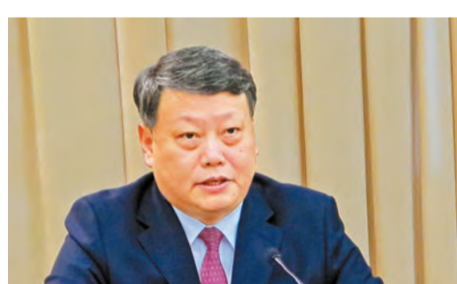
全國人大代表、遼寧省長唐一軍

回頭看反饋意見的整改落實。遼寧要把今年作為環保整改意見全面抓好中央生態環境督察回頭看和海洋督察回頭看的反饋意見的整改落實年，堅決杜絕虛假整改、表面整改、敷衍整改、一刀切等問題。舉一反三完善監督管理措施，注重主流源頭上整治，從根本上解決問題，建立常態長效機制，確保通過反饋意見的整改落實，推動遼寧生態文明建設邁上一個新台階。