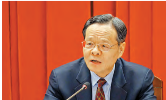
全國人大代表、廣西壯族自治區主席陳武

大舉措，現在因地制宜，結合廣西的實際，廣西各地各市各縣結合本地的實際，走出了一條產業扶貧的路子。」陳武舉例說，在種植方面，結合廣西大石山區的情況，重點推廣水果、中藥材、林木等，現在產業扶貧的覆蓋率已經超過了80%。