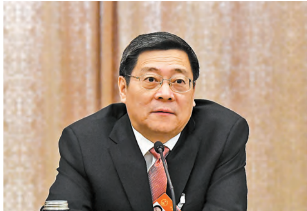
全國人大代表、湖南省委書記杜家毫

【香港商報訊】記者李銀明報道：7日，湖南代表團第四次全體會議向媒體開放，吸引了多家中外媒體記者前來採訪。對於央視記者提到湖南推進供給側結構性改革有哪些進展時，全國人大代表、湖南省委書記杜家毫表示，這幾年湖南推進供給側結構性改革力度之大、範圍之廣在歷史上前所未有。