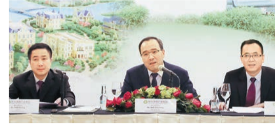
恒大健康昨發布2018年全年業績，管理層並表示，公司正進入大健康與新能源汽車雙輪驅動發展階段。

【香港商報訊】記者黃裕勇報道：恒大健康(708)發布2018年全年業績公告，多項核心指標實現大幅增長，其中會員消費額34.6億元，同比大增139%；營業額31.33億元，同比大增136%；毛利潤11.45億元，同比增長35.3%。恒大健康正式進入大健康與新能源汽車雙輪驅動發展階段。