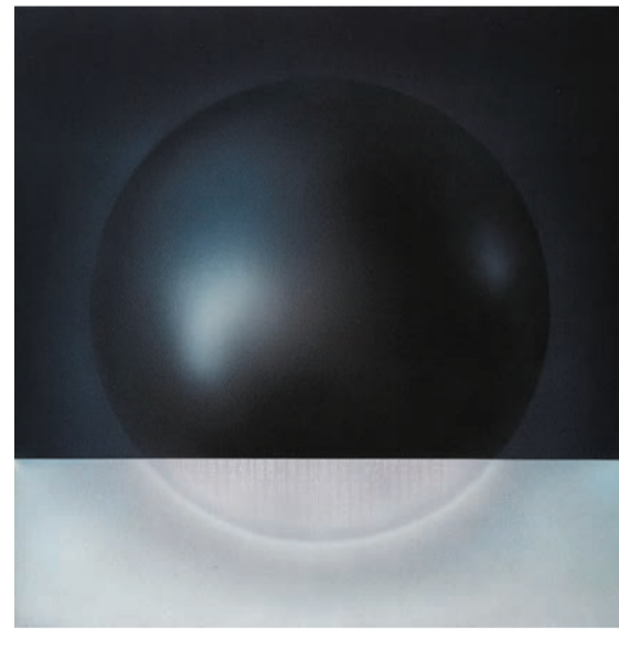
韓志勳作品《浮提》，1976年。