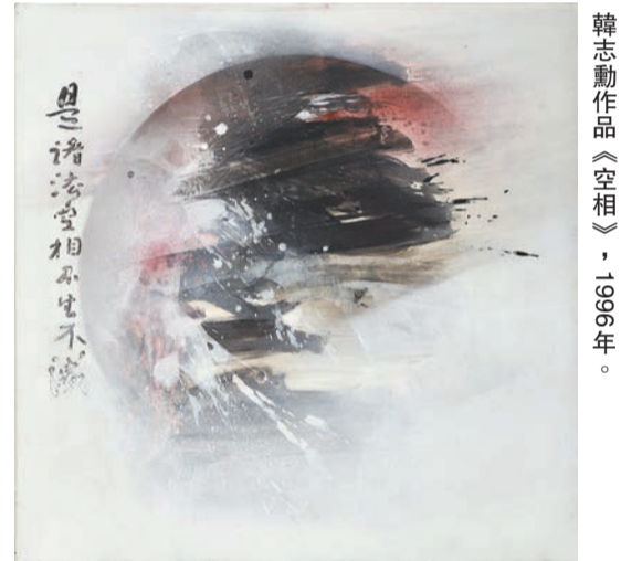
韓志勳作品《空相》，1996年。

日期：即日起至6月9日 時間：星期二至日上午11時至下午6時 每月最後一個星期四上午11時至晚上8時 地點：金鐘正義道9號亞洲協會香港中心麥禮賢夫人藝術館