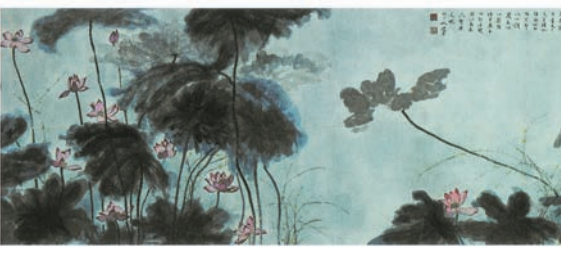
饒宗頤作品《百祿是荷》，1996年。

他的教學課程。展覽特意展出記錄饒公上世紀60年代學生的筆記，鄧偉雄表示：「饒教授早年的學生把當時上課記錄的筆記捐出，彌足珍貴，亦讓大家窺見其教學課程是如何細緻、深入。」這些筆記均為展覽的亮點展品。此外，展品《伯牙心法》為荷蘭漢學家高羅佩原藏，是饒公與世界各地漢學家交往的見證，而《殷代貞卜人物通考》則是饒公以20年心力研究撰寫的專著，出版後獲中外學術界高度重視。展出的書畫作品中的亮點作品則為巨幅繪畫《百祿是荷》，「該畫高達6呎，長約32呎，應為世界上現存最大型繪寫荷花的國畫。」鄧偉雄解釋道。作為主辦方，他亦表示挑選的展品以能表達饒公「學藝雙攜」為主，書畫類展品呈現饒公如何把學術研究如宗教、敦煌、文字學、禪學等融入其藝術創作中。「我們希望觀者了解到饒教授在港大期間，除培育英才外，還通過自己各方面的學術研究及對中國傳統文化的傳承，從一位香港本地大學教授，逐漸成為世界漢學界的傳奇人物。」