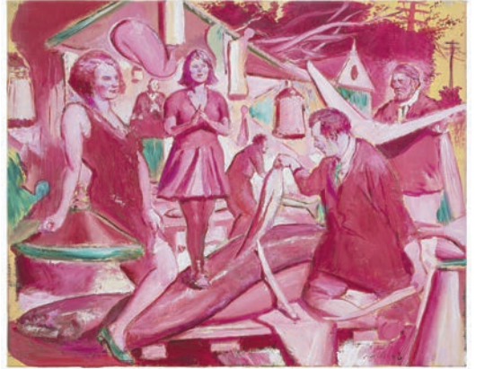
尼奧·勞赫作品《切割》，2018年。（圖片由藝術家及卓納畫廊提供）