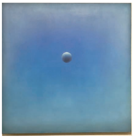
韓志勳作品《未央》，1974年。