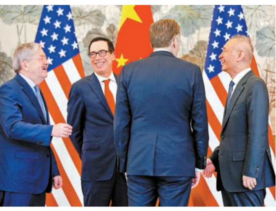
周三結束在北京釣魚台國賓館會談後，中國國務院副總理劉鶴與美方代表一起露臉讓記者拍照，相互交談，氣氛友好，但未對記者發表談話。