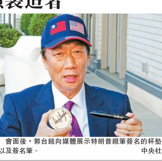
會面後，郭台銘向媒體展示特朗普親筆簽名的杯墊以及簽名筆。

此外，銀保監會新聞發言人肖遠企解讀銀行業保險業對外開放新措施指，12條開放新措施旨在進一步完善金融領域外商投資和經營環境，激發外資參與中國金融業發展的活力。比如，取消相關的外資股比限制，外資可以自由選擇參股、合資或獨資等方式在華經營，進一步促進中資和外資實行公平競爭。