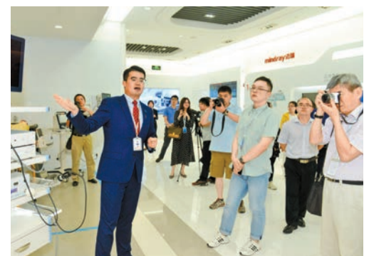
邁瑞是中國最大、全球領先的醫療器械供應商

未來，邁瑞將始終秉持「醫心一意」的核心理念，繼續以振興民族醫療工業為己任，以技術創新為精神內核，不斷推動產業戰略升級，帶動國內醫療器械產業與世界一流醫療器械企業跨越式接軌。