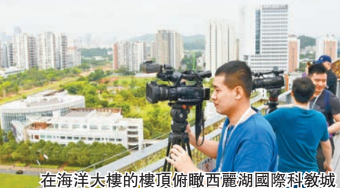
在海洋大樓的樓頂俯瞰西麗湖國際科教城

這片區域內有7所高校，2家省級實驗室，還有中科院先進院、國家超算深圳中心等科研平台，以及諾獎實驗室等等，形成了產學研用融合的全過程創新生態鏈，相當了不起。