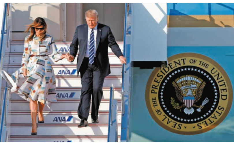
特朗普與夫人梅拉尼婭乘坐專機抵達日本羽田機場。