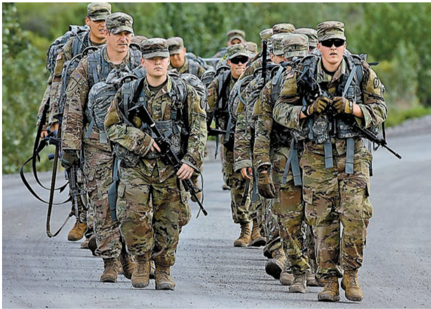
由於收入增長未能彌補軍費開支，美國5月預算赤字達到2080億美元。

赤字的大幅度提升很大程度因為6月1日是周末，使得許多6月份聯邦開支在5月份支出。要求匿名的財政部官員表示，如果考慮