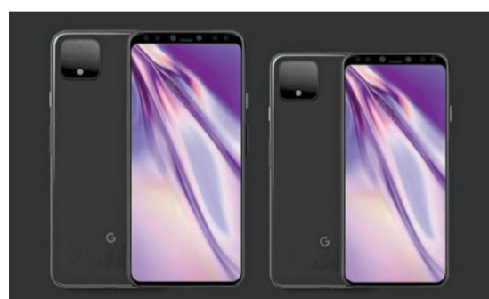
Pixel 4 手機將搭載雙後置攝像頭。 網絡圖片

渲染圖還顯示，與Pixel 3一樣，Pixel 4有一個全玻璃背殼，但這次谷歌放棄了初代Pixel以來的雙色調設計。相反，整個玻璃具有均勻的外觀和紋理。另外，由於背面沒有指紋傳感器，可以推測Pixel 4可能會採用屏下指紋設計。