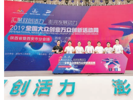
向國務院總理李克強匯報了西安「雙創」活動周開展情況。

六月仲夏季，雙創掀熱潮。13日，2019年全國大眾創業萬眾創新活動周正式啟幕，陝西省暨西安市分會場隨之啟動。西安市委常委、副市長高泉表示，西安市委要百尺竿頭、更進一步，以開展「雙創」活動為契機，聚焦「匯聚雙創活力 澎湃發展動力」主題，加強領導、精心組織、體現特色、突出實效，着力辦好「2+8+34」系列活動，切實引領全市「雙創」活動深入蓬勃開展，努力當好陝西省「雙創」排頭兵。