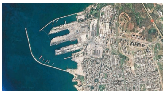
敘議員認為，擴建塔爾圖斯港有利於重振處於萎靡狀態的敘經濟，為國家重建注入動力。

法新社報導，天然氣工程建設與運輸公司1991年創建，是俄最大建築企業之一，80%的股份由俄寡頭特姆琴科持有。俄在塔爾圖斯港設有一處海軍基地。敘利亞2011年爆發內戰，作為阿薩德政府的關鍵盟友，俄2015年9月起出兵敘利亞，打擊IS等極端和恐怖組織，迄今協助政府軍收復超過60%的國土。