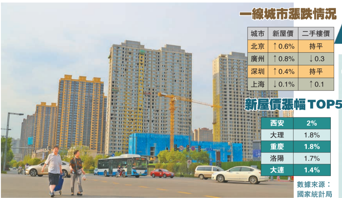
圖為山西太原某在建樓盤。