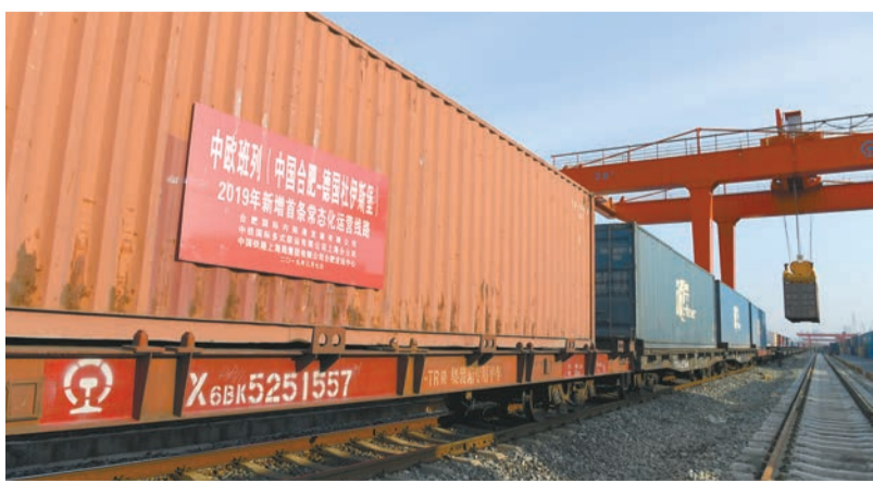
合肥中歐班列開行線路不斷增加

據了解，過去5年間，合肥中歐班列沿著「奮力打造國家級中歐班列集結中心」的既定方向，走出了一條穩定發展的「特色之路」，完成了從無到有、從有到優的雙重跨越，其變化主要表現在六個方面，包括全國排名、總量與規模、開行國家和線路、運行頻次、品牌定位以及基礎設施。