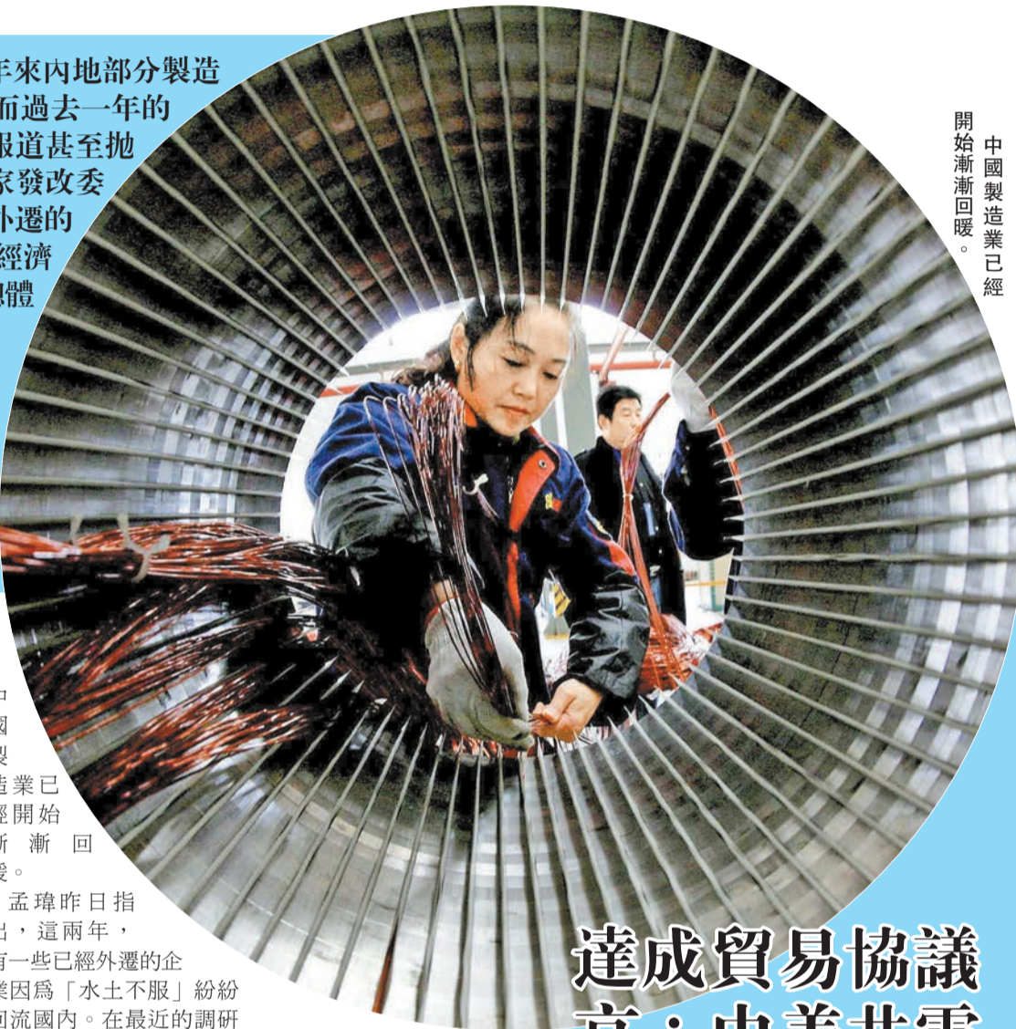
中國製造業已經開始漸漸回暖。