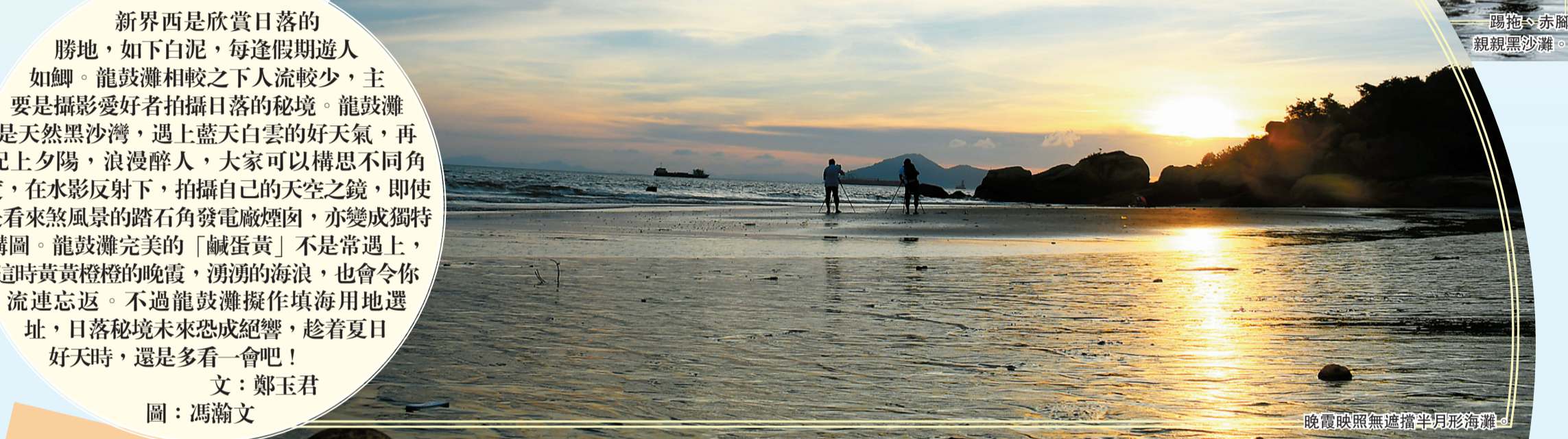
晚霞映照無遮擋半月形海灘。