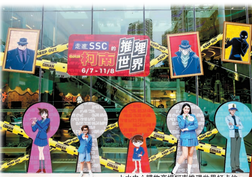
上水中心購物商場柯南推理世界打卡位。