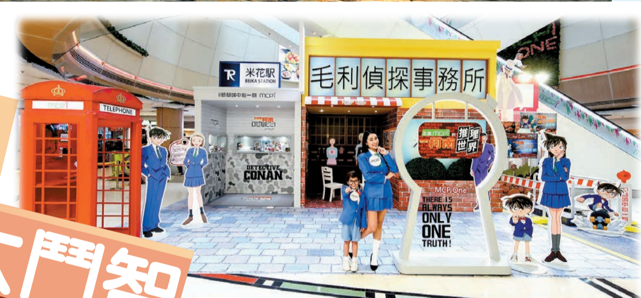
將軍澳新都城中心搭建的柯南推理世界場景，如米花町街道、紅色英倫風電話亭、米花駅等。

【香港商報訊】記者奧加報道：暑假是偵探月，名偵探柯南及福爾摩斯都現身本港商場，在他們熟悉的場景與大家大玩鬥智鬥力遊戲，此外，化身小偵探的你還有機會獲得精美小禮品。