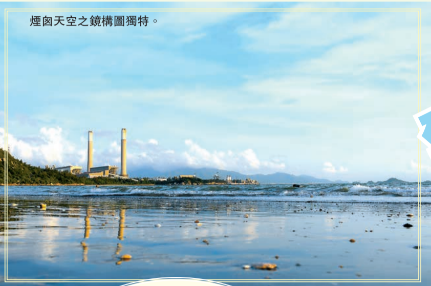
煙囪天空之鏡構圖獨特。