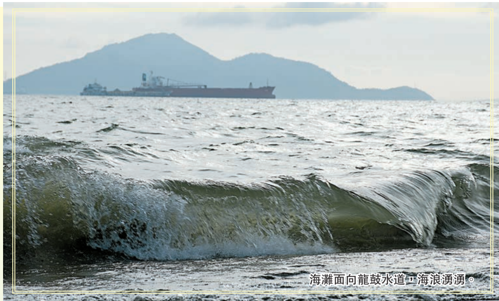
海灘面向龍鼓水道，海浪湧湧。