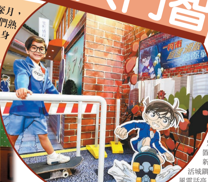
小柯南在新都城中心體驗極速滑板追逐戰。