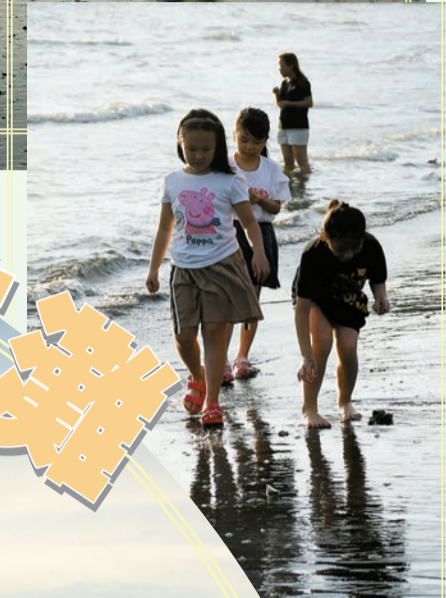
踢拖赤腳親親黑沙灘。

新界西是欣賞日落的勝地，如下白泥，每逢假期遊人如鯽。龍鼓灘相較之下人流較少，主要是攝影愛好者拍攝日落的秘境。龍鼓灘是天然黑沙灣，遇上藍天白雲的好天氣，再配上夕陽，浪漫醉人，大家可以構思不同角度，在水影反射下，拍攝自己的天空之鏡，即使是看來煞風景的踏石角發電廠煙囪，亦變成獨特構圖。龍鼓灘完美的「鹹蛋黃」不是常遇上，這時黃黃橙橙的晚霞，湧湧的海浪，也會令你流連忘返。不過龍鼓灘擬作填海用地選址，日落秘境未來恐成絕響，趁着夏日好天時，還是多看一會吧！