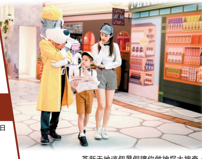
荃新天地這個暑假讓你做神探大搜查。