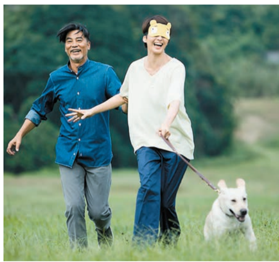
▲梁詠琪(白衫)戴上眼罩嘗試被小Q引路的滋味。