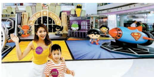
Q版超級英雄空降香港。

為答謝讀者支持，現送出由「皇室堡」提供的15份「正義聯盟投影電筒及『棋』趣套裝」，讀者只須把姓名及聯絡電話號碼，電郵至tr@hkcd.com.hk，註明「換領皇室堡禮品」，就有機會獲得乙套，先到先得，數量有限，送完即止。