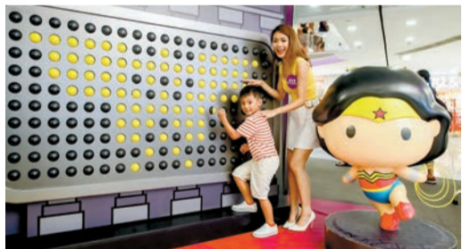
「正義聯盟大比『拼』」遊戲，考驗玩家對英雄標誌的熟悉程度。

想成為正義聯盟的新成員，就不要錯過商場地下中庭的6大打卡場景，以及挑戰兩大互動遊戲區。首先映入眼簾的是「正義聯盟基地大廳」，入場人士可先在此報到，再與首次登陸香港的水行俠及超人的火箭打卡。Q版水行俠會帶同戲中的經典三叉戟到場，而超人則與極速火箭一起現身，非常有型。場內並會重現「蝙蝠俠小丑大戰葛咸市」的場景，動感十足。想測試自己有沒有做英雄的潛能，就要參與「The Flash! 左閃右避光速跑」，遊戲讓大家化身成為擁有光速移動超能力的閃電俠，體驗光速奔跑的感受，更有機會贏取正義聯盟投影電筒，旁邊亦有霓虹燈牆可供打卡。「正義聯盟大比『拼』」就考驗參加者對聯盟各成員標誌的熟悉程度，完成後有機會獲得正義聯盟貼紙。 即日起至9月1日，於場內消費滿指定金額或商場會員可憑指定積分帶走彈彈筆、「棋」趣套裝等禮品。8月18日還有「正義聯盟見面會」，粉絲記得留意！文：Janice