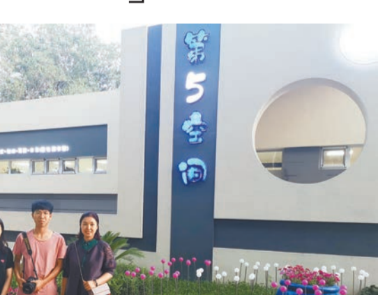
新疆奎屯第五空間

走進大廳，記者一下子就被裏面的設施震撼到了。走進去，記者一下子就被裏面的設施震撼到了。各類圖書雜誌、電子閱讀器、智能按摩椅，心率、血壓測量儀都安放在第五空間的各個角落，居民在第五空間內可以隨意閱讀圖書，第五空間也已成為了奎屯