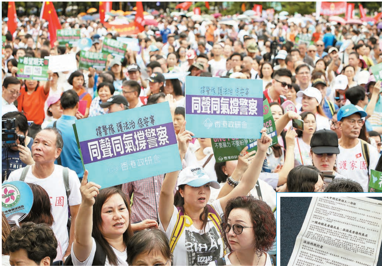
連日來，香港不同團體組織和平集會呼籲守護法治、支持警察嚴正執法。

【香港商報訊】記者馮仁樂報道：反修例爭議持續之際，本港商界繼續發聲，呼籲社會停止暴力，共同守護香港。昨日，合和實業主席胡應湘以「第三代香港居民」名義在報章刊登全版廣告，呼籲社會向「港獨」及「暴動者」說不，並向警隊致敬；嘉華集團主席呂志和出席一個活動時亦指，以「暴力、暴亂」方式表達訴求並無益處，強調香港的經濟繁榮需要老、中、少共同合力維護，冀望各界互助互諒。（尚有相關報道刊A2、A3版）