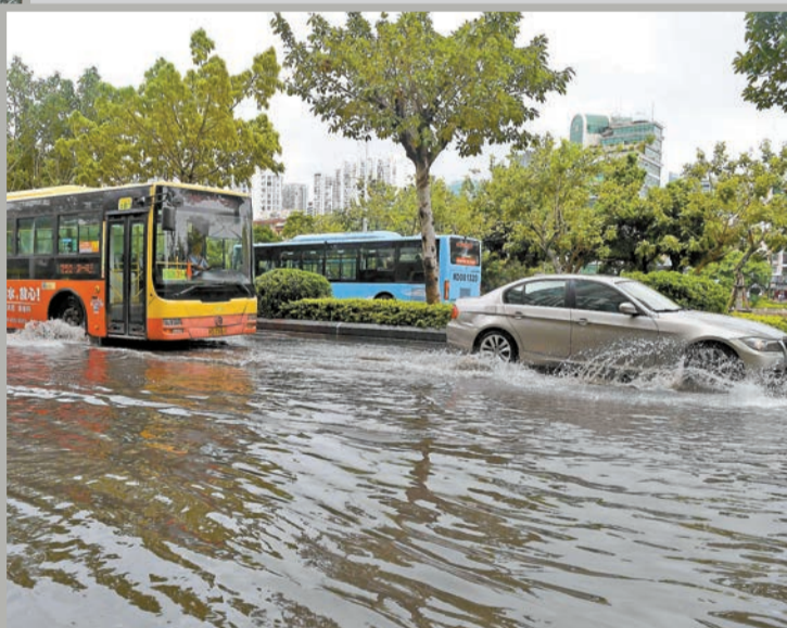
圖為昨日福建廈門車輛經過積水路面。

【香港商報訊】颶風「白鹿」於25日7時25分在福建省東山縣沿海登陸，截至昨日下午，尚未造成人員傷亡。中央氣象台當日18時繼續發布暴雨黃色預警：預計8月25日20時至26日20時，福建南部、廣東大部、廣西中東部、江西西南部、湖南中南部和北部等地的部分地區有大到暴雨（100毫米-200毫米）。