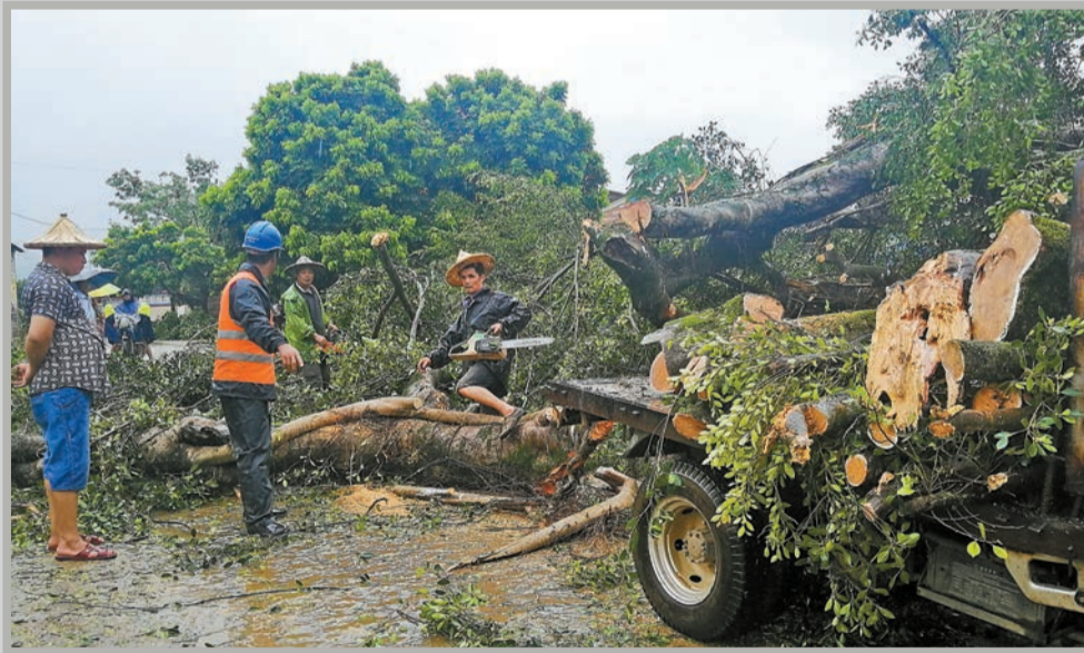
福建漳州百年老榕樹昨日被吹倒。中新社