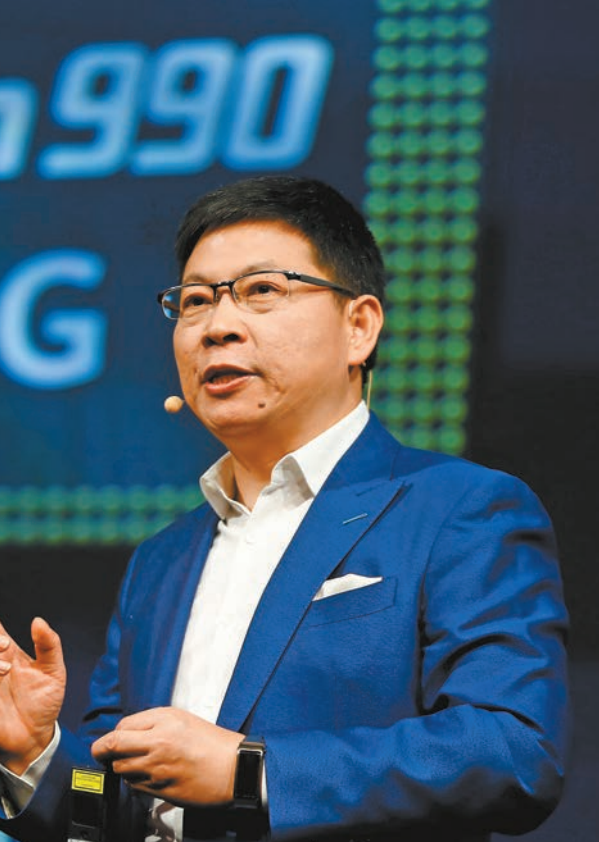
余承東在IFA2019大會上介紹麒麟990系列芯片。

華為當日還在德國和中國發布華為P30 Pro新配色：墨玉蘭、煙紫色。兩款新配色採用亮面與霧面拼接設計，手感細膩。華為表示希望P30系列能在銷量上再進一步，通過新配色吸引更多用戶。