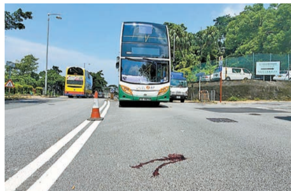
女子被新巴撞飛不治，現場路面遺下血跡。

【香港商報訊】記者馮仁樂報道：港島薄扶林發生致命交通意外，一名21歲女子在薄扶林公衆騎術學校對開橫過馬路時，當時慢線有小巴停站落客，一輛新巴駛至疑車長視線受阻，將女子撞倒，飛彈4米後倒地，重傷昏迷，送院搶救後不治。警方接報到場調查，事後新巴車長涉危險駕駛被捕。