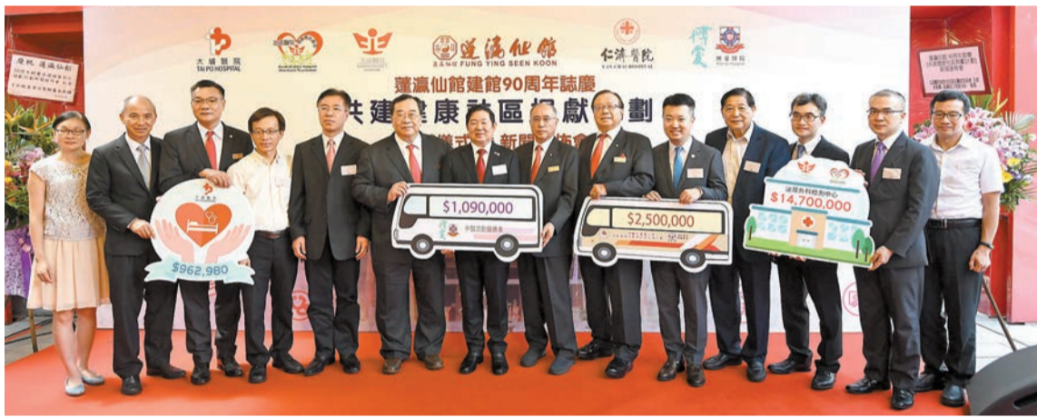
蓬瀛仙館「共建健康社區捐獻計劃」昨舉行儀式。

新界東聯網泌尿科教授吳志輝表示，推算2023年北區、大埔及沙田老人比例將增加至77%至99%，北區醫院現時處理約6000宗泌尿求診個案，輪候時間約4至5個月。他說，中心將在今年底動工，預料明年底投入使用，預計首年服務人數約6000人，而中心每年最多可處理1.2萬宗求診個案。他相信中心落成後，可大幅改善服務質素，令病人輪候時間縮短至2、3個月。