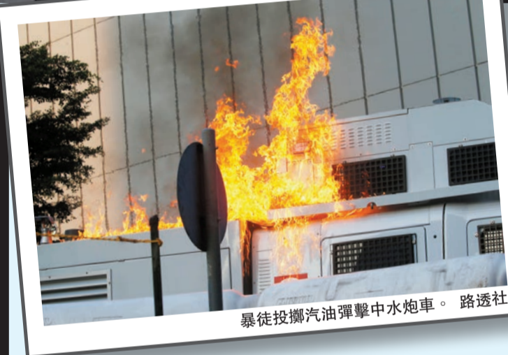
暴徒投擲汽油彈擊中水炮車。

【香港商報訊】記者周偉立報道：民陣反修例遊行未獲警方批准下，有示威者昨發起「港島行街」行動，並於下午1時半起在東角道一帶聚集。遊行先佔據路面向中環方向非法遊行，後於灣仔及金鐘一帶用雜物堵路，大肆破壞港鐵站內外設施；沿途破壞建築物外慶祝國慶的橫幅，更燒毀酒店外懸掛的國旗，行為令人髮指。期間，大批全副裝備暴徒衝擊政府總部大樓，投擲幾十枚汽油彈，警方遂出動水炮車驅散暴徒。之後，暴徒又折返，相繼為禍灣仔、銅鑼灣、炮台山、北角等地，襲擊路人和警察。（尚有相關報道刊A2、A3版）