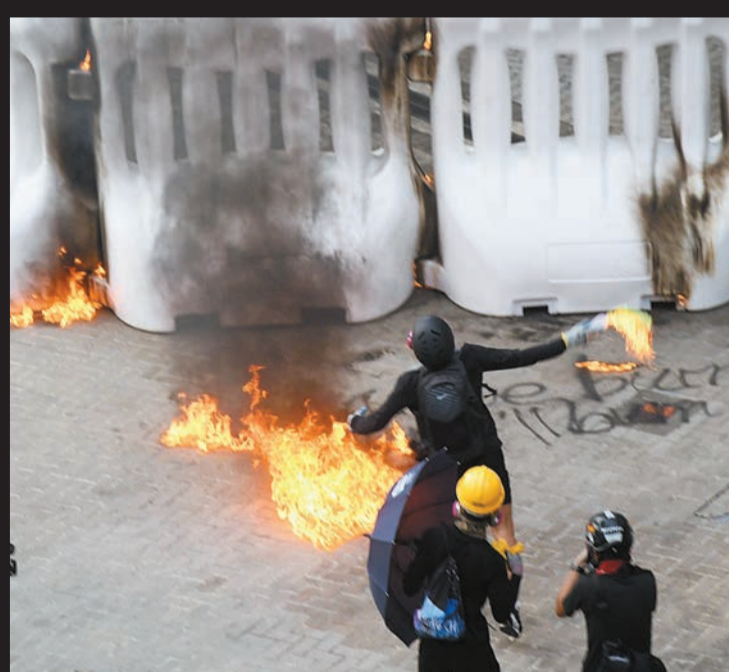
暴徒向政府總部大樓投擲汽油彈。

【香港商報訊】記者周偉立報道：民陣反修例遊行未獲警方批准下，有示威者昨發起「港島行街」行動，並於下午1時半起在東角道一帶聚集。遊行先佔據路面向中環方向非法遊行，後於灣仔及金鐘一帶用雜物堵路，大肆破壞港鐵站內外設施；沿途破壞建築物外慶祝國慶的橫幅，更燒毀酒店外懸掛的國旗，行為令人髮指。期間，大批全副裝備暴徒衝擊政府總部大樓，投擲幾十枚汽油彈，警方遂出動水炮車驅散暴徒。之後，暴徒又折返，相繼為禍灣仔、銅鑼灣、炮台山、北角等地，襲擊路人和警察。（尚有相關報道刊A2、A3版）