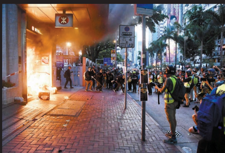
暴徒於灣仔站縱火，港鐵再遭殃。