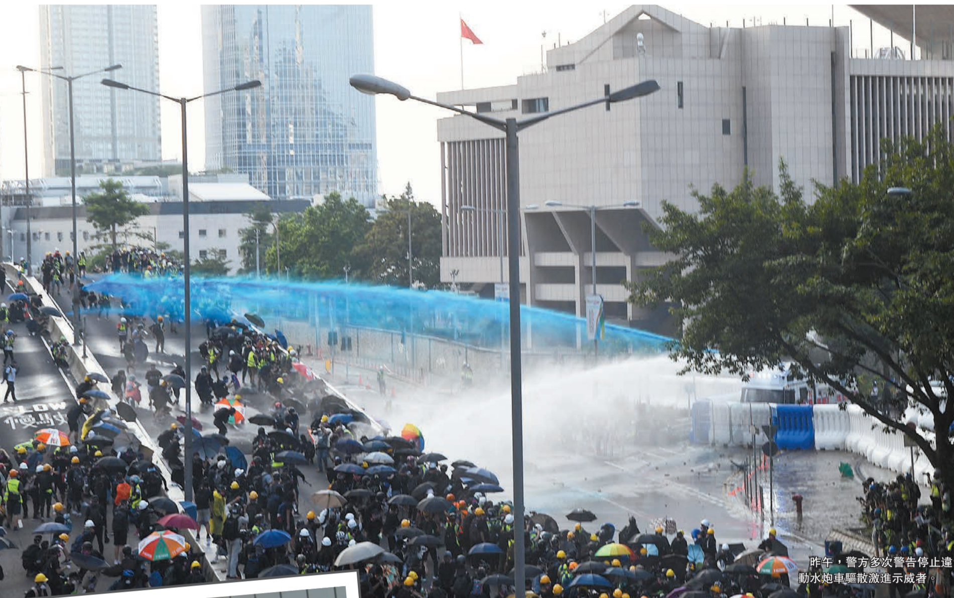
昨午，警方多次警告停止違法行為不果後，於政府總部大樓附近出動水炮車驅散激進示威者。