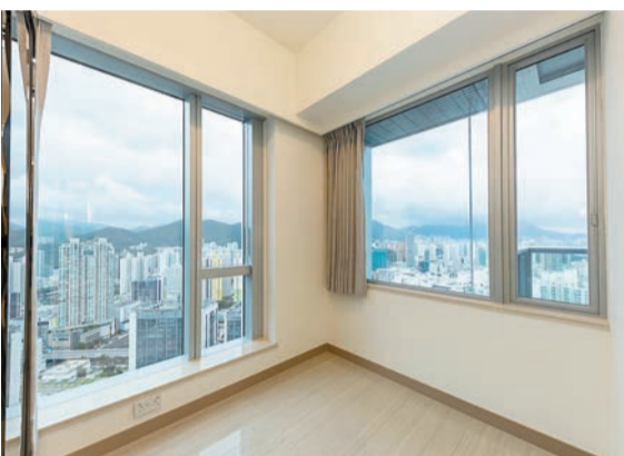
現樓8座48樓H室，實用面積391平方呎，一房間隔，睡房設有雙邊大窗，增強空氣對流。