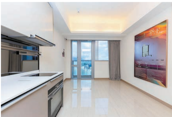
現樓8座48樓E室，全開放式間隔，外連露台。