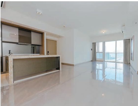
現樓7座48樓A室，實用面積1513平方呎，四房雙套房間隔。

整個匯璽項目內有兩間住客會所，供各期業戶享用。5樓平台設有50米長戶外游泳池、25米長兒童游泳池及戶外雅座等。其他會所設施包括燒烤場、健身室、多用途運動場、兒童遊樂場、麻雀室、卡拉OK室、宴會廳等。項目