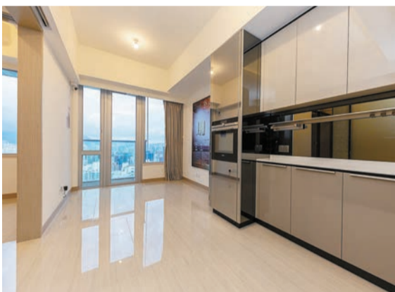
現樓8座48樓F室，實用面積350平方呎，一房間隔。