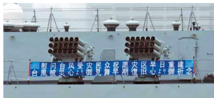
中國海軍太原艦懸掛慰問日本災民的橫幅。

【又訊】中國駐日本大使館昨日說，12日在東京灣沉沒的巴拿馬籍貨輪上6名中國籍船員確認遇難。至此，該艘貨輪上的7名中國籍船員中，6人確認遇難，另一人獲救。領保工作人員當天已抵達事發現場，並探望了獲救船員。