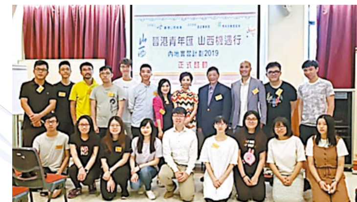
「晉港青年匯·山西機遇行」內地實習計劃啓禮。