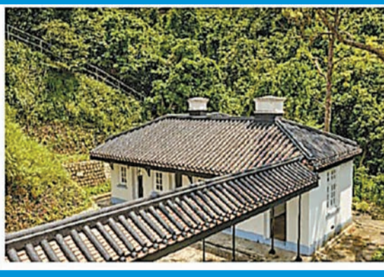
芳園書室在荃灣馬灣。