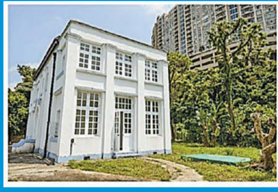
大潭篤抽水站員工宿舍群，位於香港大潭水塘道，屬法定古蹟，共涵蓋三批建築物。