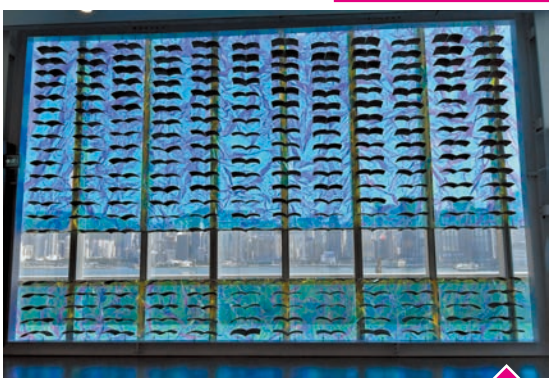
馮永基根據吳冠中作品《雙燕》創作的《我與吳冠中對話》，2019年。根據吳冠中作品中白牆黑瓦的特色，用上了瓦片及特殊反光材料創作。

香港藝術館經過逾4年的大型擴建及修繕工程後，近日終於與市民見面。現時館內有11項展覽同時舉行，大部分展覽免費入場，展期至明年春夏季。