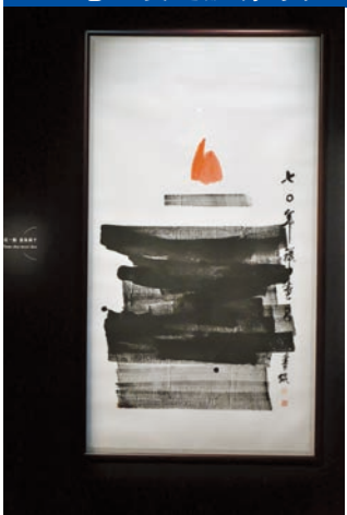
呂壽琨作品《禪畫》，1970年。

想過一個充實、有意義的聖誕假期，筆者推介到最近重開的香港藝術館。翻新擴建後的藝術館樓高7層，展覽空間約有一萬平方米，遊走於新的展覽空間內，邊體會藏品背後隱藏的故事，邊感受源於經典展品的「變奏」藝術品，實乃一眾文青放鬆身心、悠閒度過假期的不二之選。文：Janice