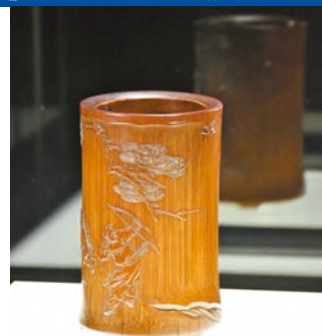
展品《淺浮雕丁山射雁圖筆筒》。於「小題大作——香港藝術館的故事」展出。館方特意打造昏暗的環境，燈光下的展品更為突出。