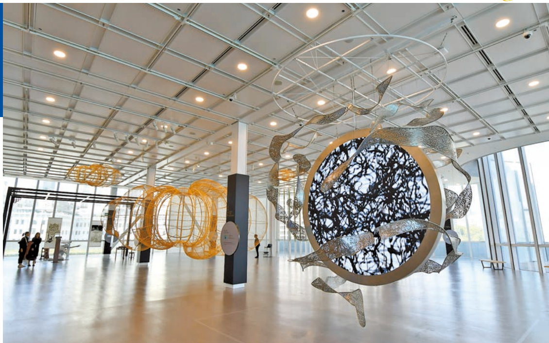
黃宏達作品《混沌初開》，2019年。（最右）