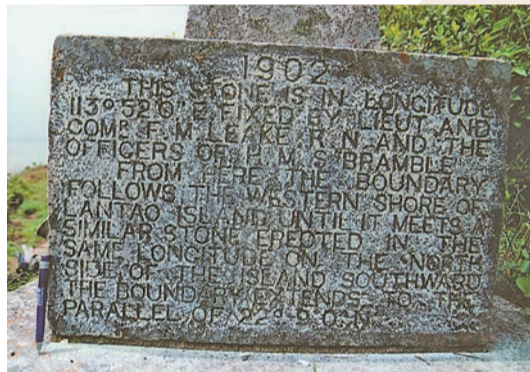
狗嶺涌山崗1902年英文界碑石。

他表示，如果將中英街5號、6號界碑單獨列入香港「法定古蹟」有難度，但是否必須要符合「法定古蹟」標準不太重要，因中英街界碑有其獨特性，是否能列入「法定古蹟」標準亦非缺一不可，如本港現時已有8個「摩崖石刻」被列入「法定古蹟」，但最近在石澳又發現一個「摩崖石刻」，仍申請為「法定古蹟」，藝術價值並非指最佳，而是指年代悠久，具有歷史價值及獨特性。丁新豹指，如果將港界大澳象山「嶼北界碑」和狗嶺涌「嶼南界碑」這2塊海域界碑與「中英街」一併「打包」列入「法定古蹟」相信是可以。他表示，會與其他前古