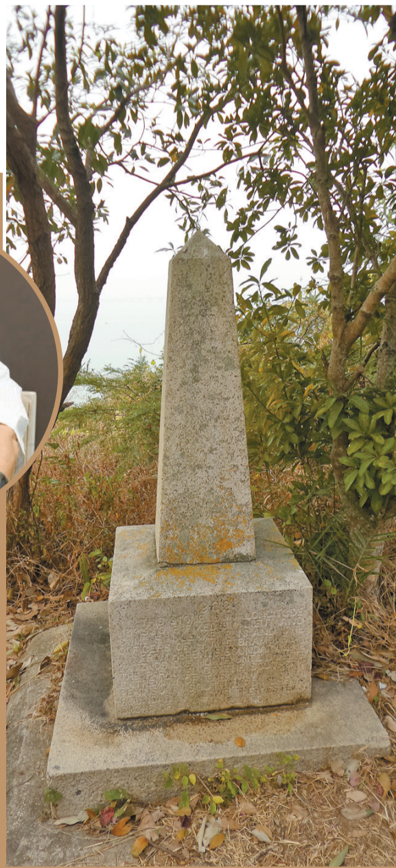
▲「嶼北界碑」位於大澳大象山間小路旁，該碑刻文清晰可見。