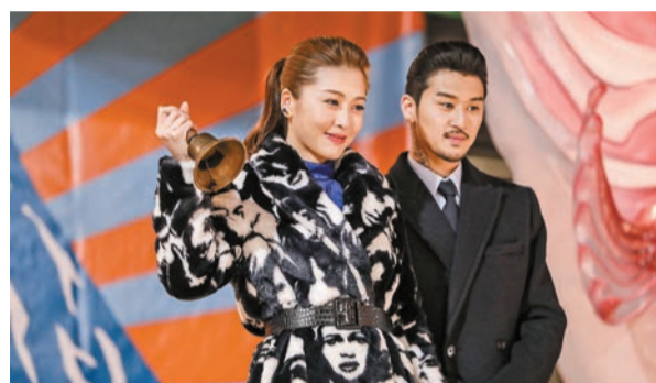
周勵淇在電影中改形象飾演潑辣女友。