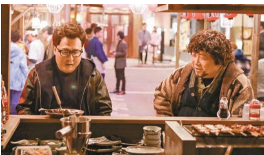
流落日本的甄子丹(左)得到王晶(右)幫助重新振作。

甄子丹在剛過去的聖誕檔期為電影《葉問》系列寫上句號，卸下宗師招牌的他在賀歲電影《肥龍過江》中，改形象化身為200多磅的肥仔，聯同毛舜筠、周勵淇、王晶、日本演員竹中直人及渡邊哲等，由香港打到日本為觀眾送上久違的喜劇打鬥賀歲片。從不吃零食的甄子丹，為了融入角色在戲內戲外大吃零食，婚後不接拍攝親熱戲份的他，更會與周勵淇激演親吻戲份。