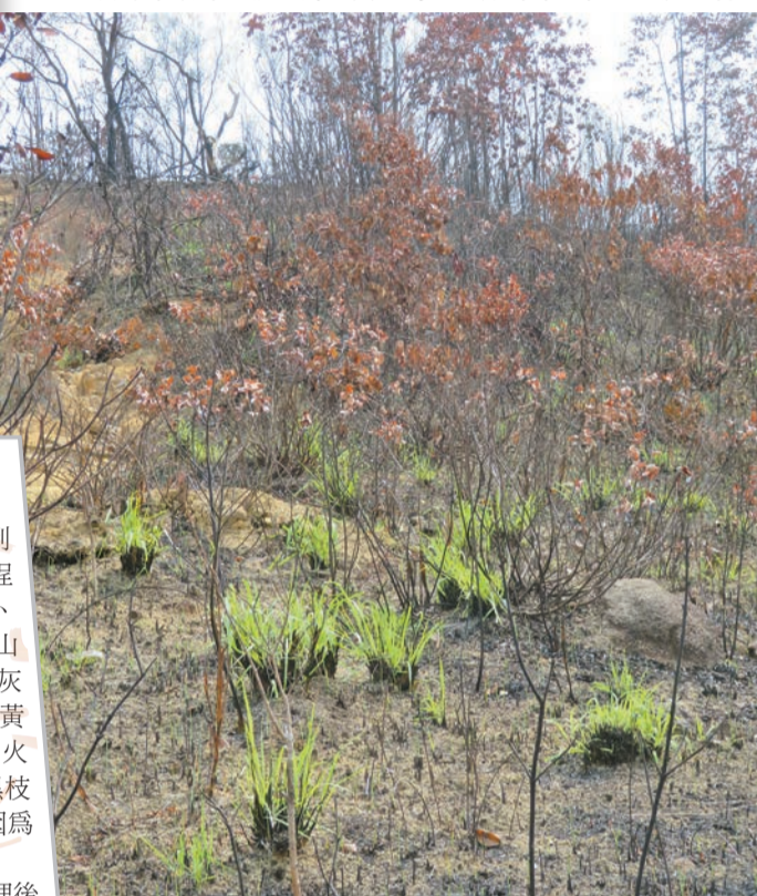
草類植物於火災後最快生長出幼苗。