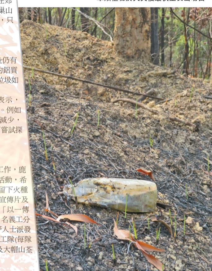
記者清徑時，發現尚未燒盡的膠樽。