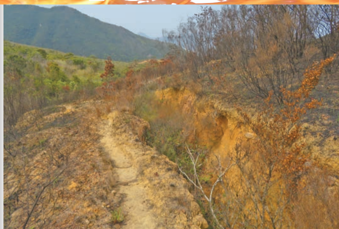
沒有綠披的山坡，驚見黃土溝，左方的綠色植物位處山谷。