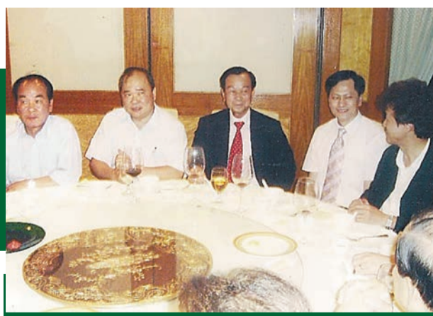
2006年英國華人社團聯合總會返港訪問鄉議局，主席劉皇發（左三）假九龍會設歡迎宴。左二為「肥仔」鄭健文。

肥仔衷心的讚嘆，發叔非常投入鄉事工作。發叔除了與英國鄉僑會面，也包括與荷蘭、比利時、德國等其他旅居歐洲的鄉僑開會，發叔通常是來者不拒，只要是新界人有什麼困難，他都一定盡力幫忙。