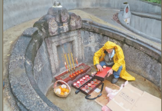
生豬暫由紙皮覆蓋，免被雨粉弄至水汪汪。

另外，4月2日龍口山頭拜祭鄧旺公(十八世祖鄧若虛親弟鄧文光)食盆菜環節亦取消。原本拜祭後，生豬運回鄧若虛書室廚房，跟食山頭一樣，與其他三種材料合成盆菜，由拜祭者拿走與親友品嘗。食盆菜因疫情問題取消，拜祭者每丁獲分配豬肉及派50元。