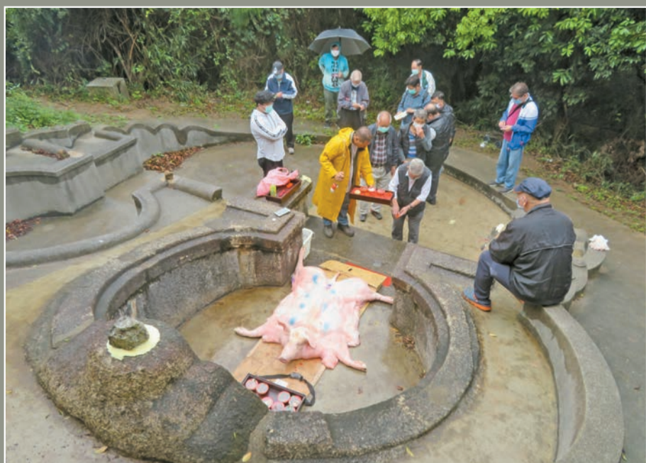
屏山鄧族龍鼓灘春祭取消食山頭，陰雨天雨下，出席族人少，並要輪流拜祭，免同時聚集太多人。

【香港商報訊】記者鄭玉君報道：屏山鄧族春秋二祭到龍鼓灘拜祭時食山頭的習俗，今個清明節因疫情緣故無奈被取消，只進行原有的生豬拜祭儀式，在春雨綿綿下，到場致祭者總計有40多人，相比去年重陽食山頭的200多人，人數少了八成。