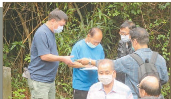
山頭即場登記，每丁獲派50元，回到祠堂分豬肉。