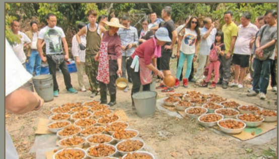
屏山食山頭的拜祭活動，向有二百多人出席，打盆時圍觀者眾，但今年春祭因疫情取消，熱鬧情景不再。