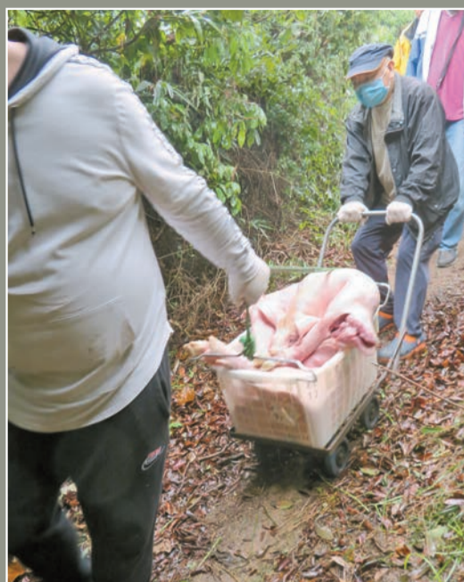
拜祭完畢的生豬運回屏山祠堂，分給曾到山頭的子孫。