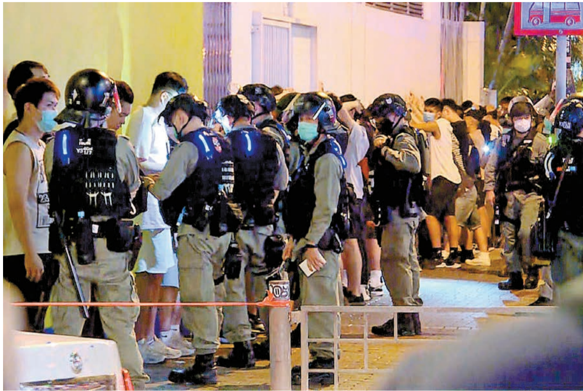
警方在旺角花園街優才書院對開查大批聚集示威者，及後全部拘捕帶署扣查。

政府發言人續說，未成人人士以學生記者身份在示威現場進行採訪，是極為危險的行為，當局對有組織安排年幼學生作義務採訪，感到十分憂慮，這實屬置孩子的安危於不顧，是極度不負責任的行為。而且，